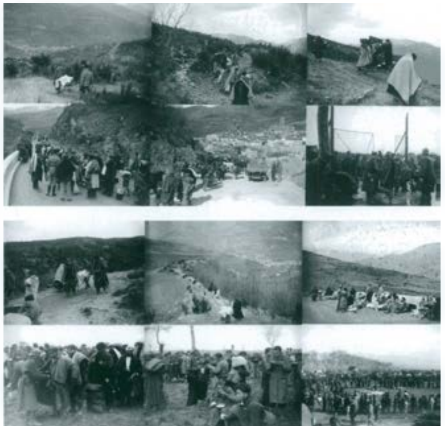
"Les refugiadats espanyols se dirigeant vers Prats de Mollo" i "Les milicians a un camp du Boulou". Fotografies del diari Excelsior , 28 de gener/16 de febrer de 1939

Ara farà 30 anys de la fi del règim feixista del general Franco, i en farà 70 de l'aixecament militar colpista de 1936. Arreu del país i gràcies a la "revolta dels néts" s'està produint un extens i vigorós moviment de recuperació de la memòria democràtica estroncada arran de la guerra civil. Després de tants anys d'una sola visió interessada dels fets, que esclafava l'altra –la democràtica–, cal continuar reivindicant la necessitat de ressituar persones, institucions i sobretot arguments. Cal conèixer i donar a conèixer una realitat silenciada durant 40 anys i amagada subtilment sota la catifa de la transició democràtica. Aquest sembla l'objectiu didàctic de l'exposició del CCCB, recuperar la veu, la imatge, els noms i els motius.