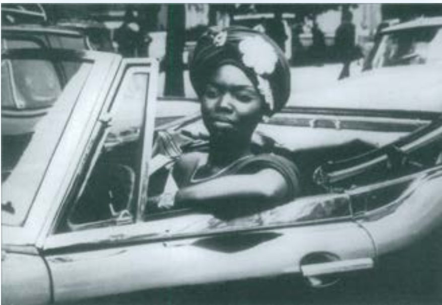
Petit a Petit

Chronique d'un été (1960, 90 minuts) és el film canònic del que es coneixerà com a cinéma-vérité . Es tracta, efectivament, d'una sèrie d'entrevistes i d'enquestes a joves parisencs a l'estiu de 1960. Codirigida per Jean Rouch i Edgar Morin, dedica el seu tram final a la projecció de la pel·lícula davant dels mateixos entrevistats -que n'emeten opinions contraposades- i, per acabar, a la reflexió final dels dos cineastes, aquesta vegada sols. Utilitzant la tècnica del cinema directe -enregistrament sincrònic d'imatge i so-, Rouch i Morin cerquen la realitat -el seu cinéma-vérité - a través d'unes senzilles preguntes que pretenen descobrir l'essencial dels seus personatges: l'impacte emocional de la política del moment, els estats d'ànim, els moments de desesperació... Tanmateix, malgrat la indubtable sensació d'autenticitat que ofereixen moltes de les seves imatges, resten dues preguntes sense resposta. 1 a ) Tot i que el que veiem sembla real, és possible copsar realment la veritat sense la confrontació dialèctica del que diuen els personatges amb el seu present contextual? 2 a ) Són vertaderament ells quan parlen, sabent com saben que se'ls està filmant? Però, si entenem que fins i tot aquests dubtes formen part del document, Chronique d'un été se'ns presenta avui com una experiència altament suggeridora.