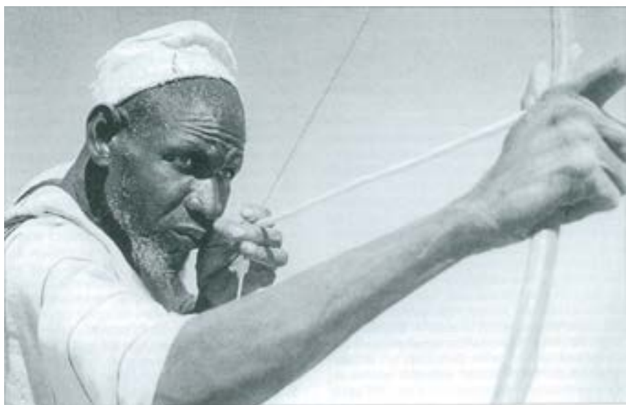
La chase au lion à l'arc.