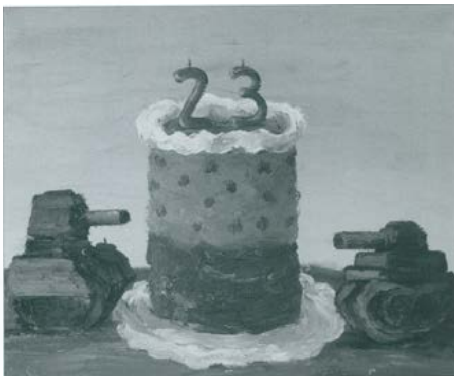
Pastis i tancs Cera sobre tela (65x54) 2005

Per a l'artista participar a la Biennial és una bona oportunitat per donar a conèixer el seu treball creatiu: "És una satisfacció i va bé tenir aquesta oportunitat per donar a conèixer la meua obra després d'acabar els estudis."