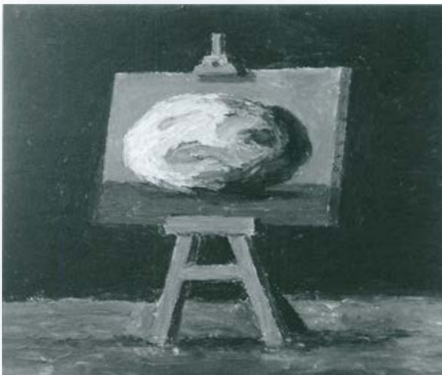
Llenç amb pedra pintada. Cera sobre tela (50x61) 2005

Josep Canals: "Podem dir amb orgull que estem presentant el millor art jove del país. El jurat ha estat exigent i ha escollit 11 artistes, de prop de 140. S'ha apostat pel jovent."