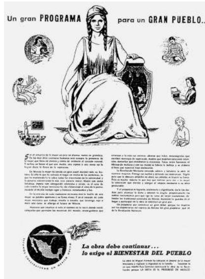
Fuente: Partido Revolucionario Institucional. (1952). Un gran programa para un gran pueblo. Estamos construyendo un México nuevo. Distrito Federal, México: Partido Revolucionario Institucional, sp.