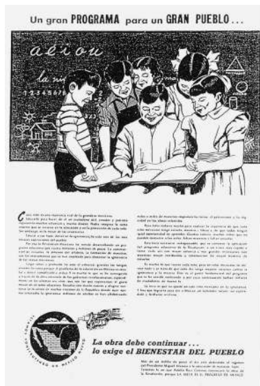
Fuente: Partido Revolucionario Institucional. (1952). Un gran programa para un gran pueblo. Estamos construyendo un México nuevo. Distrito Federal, México: Partido Revolucionario Institucional, sp.