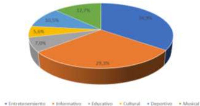
Figura 3. Programación preferida en, Radio, Televisión e Internet.

La sociedad actual disfruta la mayor parte de su tiempo del internet, escucha radio y ve televisión, es así que la figura dos nos muestra que las personas pasan de una a cuatro horas escuchando las noticias o viendo televisión, cabe destacar que de las cuatro horas en adelante hacen uso del internet, ya sea en su móvil, laptop o PC.