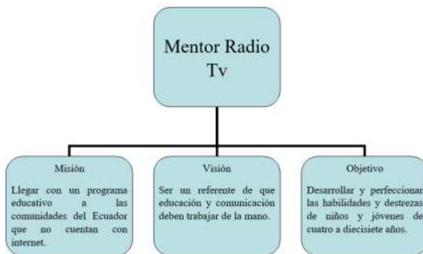
Figura 4. Estructura del programa educativo de radio y tv.

En esta parte cada distrito educativo de acuerdo a su realidad, está en capacidad de rediseñar el programa radial y adaptar a las necesidades de su realidad en su conjunto. Es importante hacer un cambio de la estructura curricular y cambios en la estructura organizativa. El programa “Mentor Radio o Mentor tv”, ayudará a desarrollar una serie de capacidades para aprender a ser persona, convivir y sobre todo a vivir.