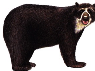
Figura 2. Apariencia de un oso de anteojos adulto.

negro es grueso y abundante. Presentan además una combinación de manchas blancas o café claras alrededor de los ojos, que pueden extenderse hasta la quijada, garganta y pecho (Figuras 2 y 3); el tamaño, coloración y forma de estas manchas suelen ser diferentes en cada individuo y son características que suelen ser usadas para su identificación a este nivel (Castellanos, 2010; Tirira, 2007).