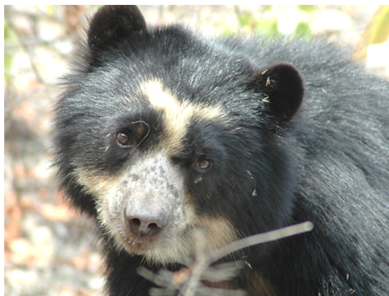
Figura 3. Oso de anteojos ( Tremarctos ornatus ).

Es un mamífero de hábitos diurnos y nocturnos, terrestre, parcialmente arborícola y solitario; también es un animal omnívoro (come frutos, materia vegetal y carne, llegando incluso a alimentarse de carroña de ser necesario). Generalmente, su dieta incluye frutos maduros, cogollos de bromelias, partes tiernas de palmas, bulbos de orquídeas o incluso cortezas de árboles (Castellanos, 2005). Sin embargo, sus hábitos alimenticios pueden cambiar acorde al lugar en el que se encuentre y de la disponibilidad de los recursos (Peralvo, Cuesta y Manen, 2005), y si el alimento es escaso, puede incluso llegar a cazar venados, roedores y en ocasiones terneros (Goldstein, 2002; Castellanos, 2005). Suele construir nidos tanto en el suelo como en los árboles altos con el propósito de descansar y para alimentarse sin interrupciones (Goldstein, 2002).