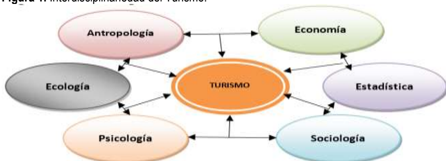
Figura 1. Interdisciplinariedad del Turismo.

Existen diferentes disciplinas relacionadas con el estudio del turismo, por lo tanto, es necesario definir las áreas comunes de éstas con el turismo, y determinar las relaciones existentes, las teorías y métodos que utilizan y que pueden ser consideradas dentro del estudio y análisis del turismo, lo que hace evidente que este fenómeno tan complejo y multifacético, asuma un papel interdisciplinario en el mundo académico (ver figura 2).