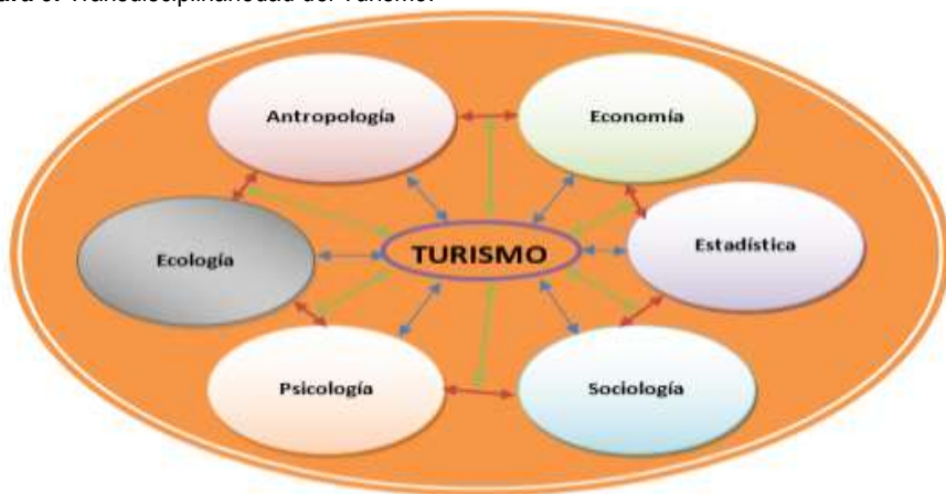
Figura 3. Transdisciplinariedad del Turismo.