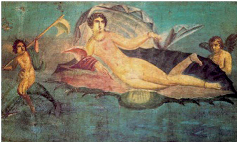
Figura 1. Venus navegando sobre una concha y amorcillos . Fresco. Casa de Venus. Pompeya. Cuarto estilo.

sios, griegos también, cuyos retratos llenaron las pinacotecas privadas [5].