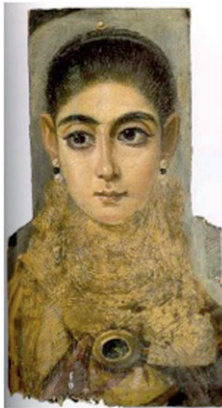
Figura 3. La Europea . Antinoé, siglo II d. C. Encaústica. París. Museo del Louvre.

de los tipos de momificación menos frecuente. Dicho tipo de momificación rodea el cuerpo inerte, embalsamado, con vendas, para después adornarlas con tachuelas doradas que dan como resultado una especie de entramado que recuerda a la estética bizantina. Este tipo del que hablamos, poco común y más cercano a Roma que a Egipto, es frecuente en los retratos de El Fayum de la última época, entre los siglos III y IV d. C. Los