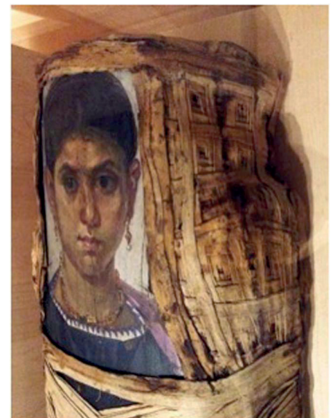
Figura 4. Momia y retrato de Eudaimonis . Antinoé, siglo II d. C. Vendas de lino y encaústica. París. Museo del Louvre.