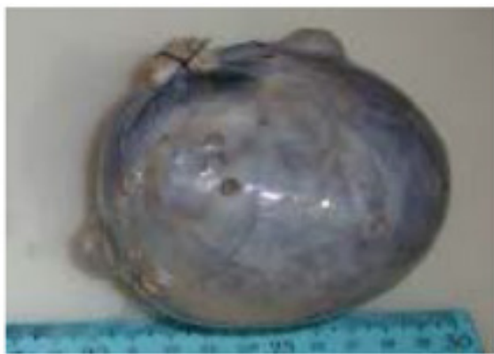
Figura 1: Ovario derecho que mide 9,3 x 7,5 x 6,1 cm; quístico, de color grisáceo con abundante y fina vascularización. Al corte, de consistencia firme y abundante tejido sebáceo y la presencia de pelos.

La evaluación anatomopatológica de la pieza quirúrgica describió un útero piriforme de 8,4x6,2x3,0 cm con cérvix, cavidad intrauterina y oviductos sin lesiones macroscópicas evidentes. El OD midió 9,3x7,5x6,1 cm, quístico con abundante tejido sebáceo y presencia de pelos (ver Fig. 1) y el OI 4,0x3,7x1,8 cm, multiquístico conteniendo abundante tejido sebáceo e igualmente presencia de pelos (ver Fig. 2). A nivel microscópico, en el OI se observó además, tejido compuesto por acinos de varios tamaños