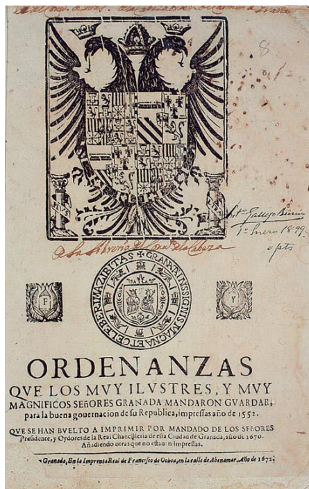
Fotografía 1. Portada. Título de las Ordenanzas que los muy ilustres y muy magníficos señores Granada mandan que se guarden para la buena gobernación de su república. Granada. 1552. (2ª Impresión por Francisco de Ochoa, 1678)

Fuente: Archivo Histórico Municipal del Ayuntamiento de Granada. Signatura: CF-24.