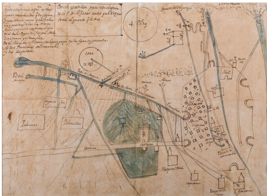
Fotografía 4. Desconocido. Plano de la acequia de Ynadamar y de los interesados que riegan y se aprovechan de ella. Letra D. núm. 1. pieza 14. n. 67. Aproximadamente siglo. XVII