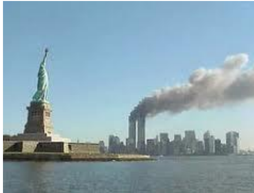
Atentado emblemático de Al-Qaeda (11-09-2001)

En este caldo de cultivo, Al-Qaeda –sobre la base del wahhabismo y del salafismo yihadista– pretende aplicar literalmente las proclamas contra los infieles. Su despliegue operativo “tipo spaghetti”, incluye dos elementos: el centro de operaciones terroristas y una red exterior de células, en situación “durmiente” o activa. Por otra parte, sus posibilidades de reclutamiento dentro del mundo islamista son casi infinitas. Conviene también recordar que, hasta el momento, Al-Qaeda emplea en sus atentados armas convencionales, pero, cuando disponga del suficiente personal técnico puede emplear armas de destrucción masiva.