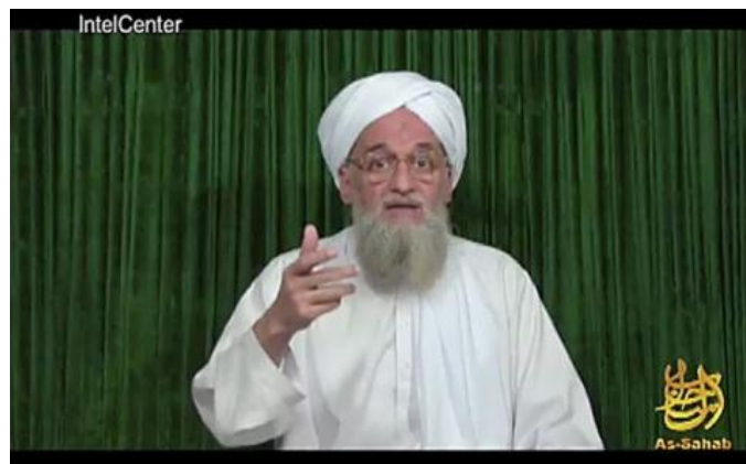
Al-Zawahiri, jefe actual de AlQaeda

L. Stimson Center” 3 , hay diversos países involucrados en la “Primavera Árabe” que tenían - ¿tienen?- programas de armas biológicas y químicas en marcha. Concretamente en armas químicas, Libia tenía acreditada su experiencia y sus instalaciones, toda vez que ya empleó gas mostaza, en 1987, contra las tropas del Tchad y, en los años ochenta, ya producía y almacenaba sarin y gas mostaza en su instalación de Rabta (Pharma 50). Por lo que respecta a Egipto , se tiene noticia de que disponía de agresivos químicos y sus investigadores egipcios tienen suficiente competencia técnica por haber estado cooperando con laboratorios civiles y militares norteamericanos en el área de defensa biológica. En cuanto a Siria , no olvidemos tampoco que, según informaciones largamente conocidas, disponía de un programa avanzado de armas químicas, en colaboración con la antigua Unión Soviética y Corea del Norte, fundamentalmente centrado en los agentes neurotóxicos sarín y VX, así como en las denominadas armas binarias.