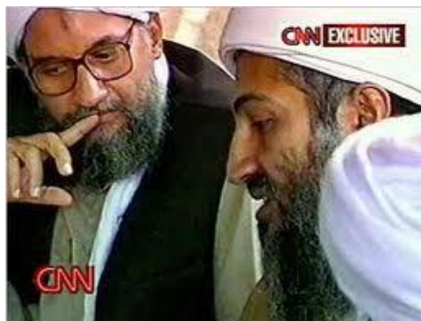
Ben Laden y Al-Zawahiri