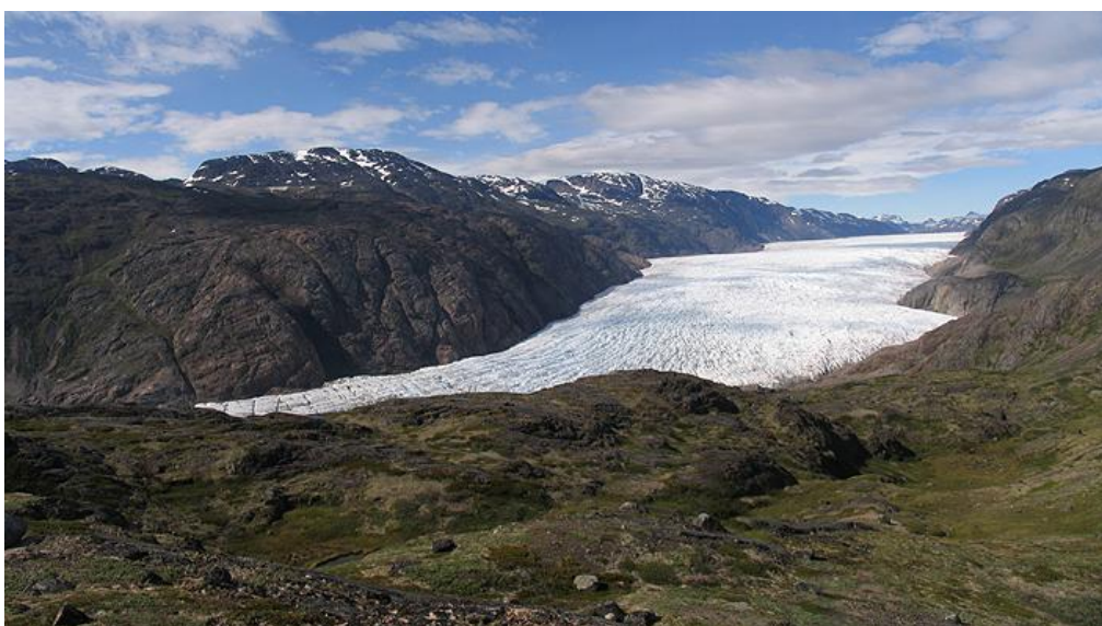
Figura 2: Glaciar Koroc, Groenlandia en 2009. Aproximadamente 20 años antes su lengua llegaba a desembocar directamente en el océano.

·Subida del nivel del mar. El rango de subida previsto para fin del siglo XXI oscila entre 18 y 59 cm respecto del nivel medio 1980-99. Debido fundamentalmente a la fusión del hielo de Groenlandia (figura 2) y al aumento del volumen de los océanos por la dilatación consecuencia del calentamiento.