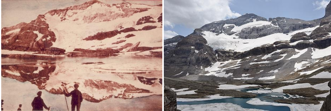
Figura 3: glaciar de Monte Perdido (Huesca) a la izda en 1900 y a la derecha en 2013.

lo que según algunos autores el retroceso actual se explica como la recuperación de la situación anterior a la mencionada pequeña edad del hielo.