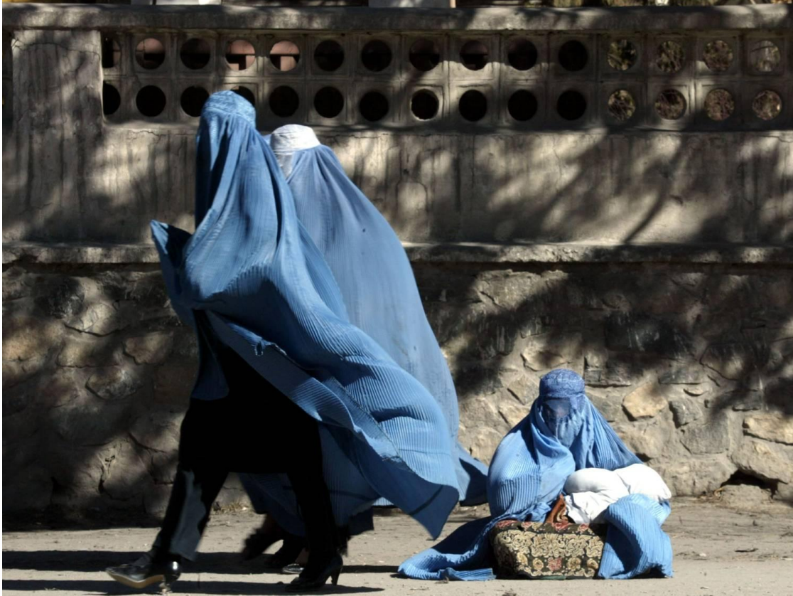
Foto 6: Mujeres paseando por Herat (nótese el detalle de los tacones).

No obstante, miles de mujeres afganas son activas social y políticamente. Hay ministras, como la de Salud o la de Asuntos de la Mujer, y la dirección de la Comisión Independiente de Derechos Humanos en Afganistán también es una mujer. El parlamento afgano sigue teniendo una de las tasas de feminización más altas, con un 27,3% 26 . Ahora bien, estas tasas que “obligan” a la presencia de la mujer en las instituciones gracias a la presión internacional, ¿serán respetadas más allá de 2014?