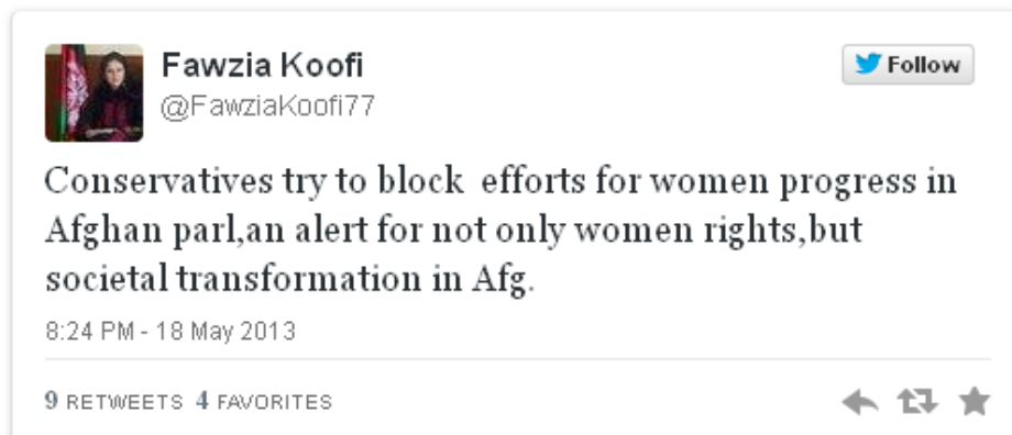
Foto 3: Cuenta de Tweeter de la parlamentaria afgana Fawzia Koofi, que se postula para la presidencia del país en 2014, con sus impresiones del debate: "Los conservadores intentan bloquear en el parlamento los esfuerzos a favor del progreso de la mujer, no solo por los derechos de la mujer, sino por la transformación social en Afganistán."