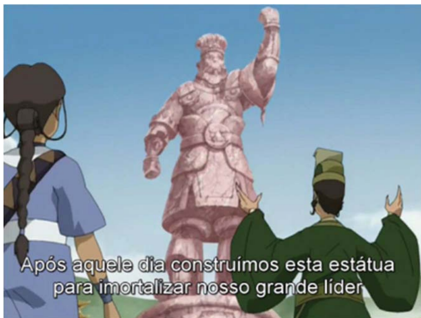
Figura 1 – O prefeito mostra a estátua de Chin a Katara e Sokka

Assim, o episódio retrata a construção histórica do passado de uma comunidade, que responsabiliza o líder morto Chin por grandes feitos, tornando este um herói, ao passo que elege como vilão o avatar. Assim, por meio dessa narrativa, a animação demonstra a forma como um povo relembra e perpetua a memória sobre um acontecimento.