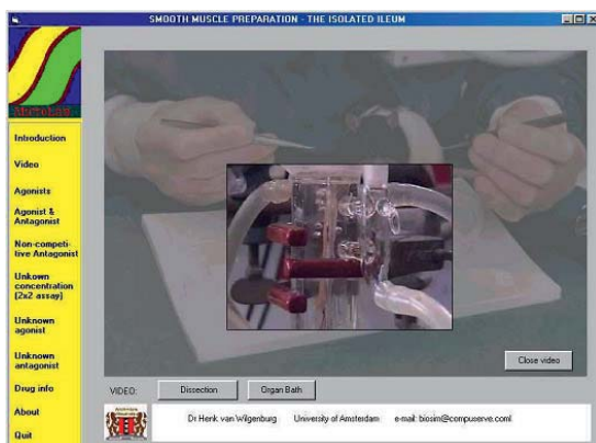
Figura 2. Administración de drogas en el baño de órganos.