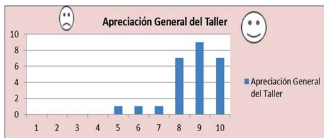
Figura 4. Evaluación del Taller

La evaluación del facilitador, mostró que la mayoría de estudiantes encuentra una satisfacción de 10/10. La puntuación más alta.