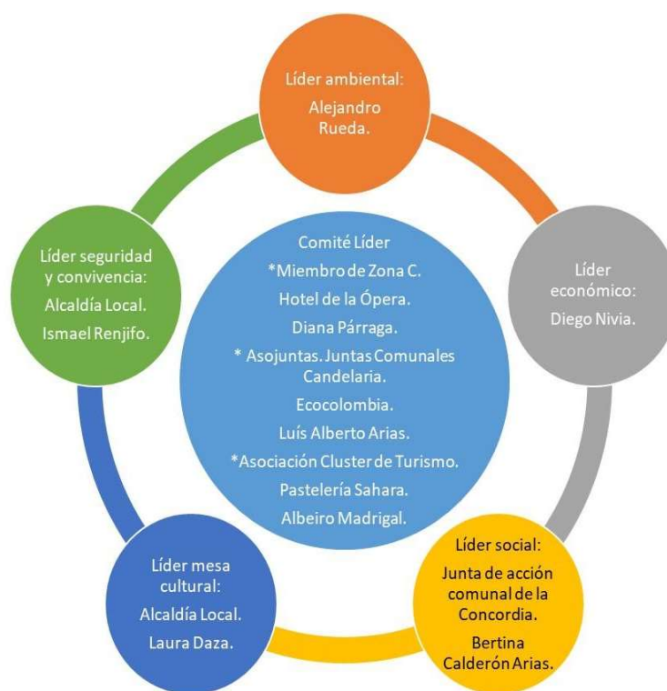
Figura 2: Autoridad Responsable

Uno de los desafíos más relevantes que implica la implementación de la Norma es “ identificar a las personas, entidades u organizaciones responsables en el cumplimiento de los requisitos de esta norma, así como los representantes en cada una de ellas ” y “ designar un responsable o líder general del proceso, el cual puede ser una persona natural o jurídica ” (Facultad de Administración de Empresas Turísticas y Hoteleras, 2014: 11). La ausencia de esta figura que la Norma denomina Autoridad Responsable, impediría poner en funcionamiento los requisitos de gestión y verificar las responsabilidades y actuaciones de cada uno de éstos con el fin último de propender por el proceso de mejora continua. Aquí se quiere destacar, por la experiencia de la Universidad Externado, que la estructura de esta Autoridad Responsable varía en cada territorio.