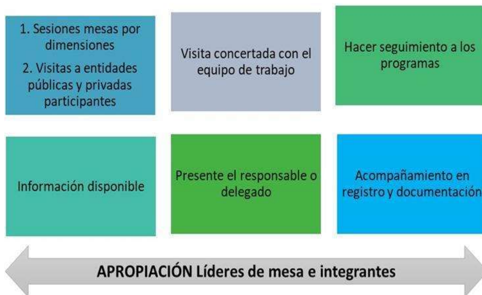
Figura 3: Descripción del proceso de asistencia técnica

Otro punto neurálgico que implica retos tanto para los actores involucrados como para el equipo de trabajo que realiza la implementación es el proceso de asistencia técnica. Este ítem se desarrolló en las cinco mesas de trabajo (mesa ambiental, mesa social, mesa cultural, mesa económica y mesa de convivencia y seguridad), conformadas por representantes de la comunidad, entidades, empresas u organizaciones del sector o con injerencia en éste, que aportaron evidencias de cumplimiento de los requisitos de la norma (Figura 3).