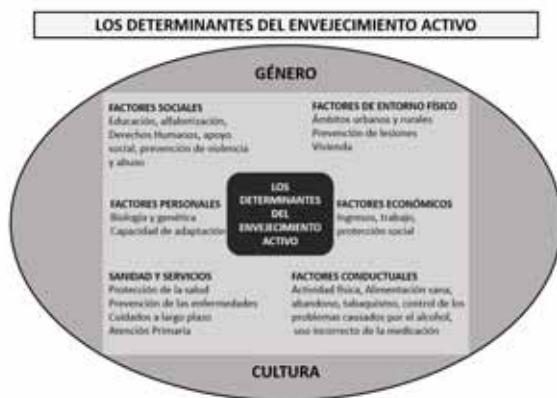
Figura 1: Pilares del envejecimiento activo.

preparación de la población hacia el envejecimiento activo. Requejo (2003) expone tres perspectivas de configuración hacia el proceso de envejecimiento, 1. Perspectiva cronológica: hace referencia a la edad de la persona y a que tener una cierta edad nos ubica en una etapa u otra de la vida. Encontramos tres edades: Edad biológica, determinada por el curso temporal de la vida, caracterizada por rasgos mentales, físicos y sociales; edad psicológica, la concepción propia sobre nuestra edad, es decir, con qué edad nos sentimos; y edad social, los comportamientos y actitudes atendiendo a la sociedad en la que se vive. 2. Perspectiva funcional: pone de manifiesto la idea de la productividad en el mayor, así como el grado de autonomía que posee. Dentro de ésta se considera como punto central la desvinculación que se produce durante esta etapa entre la persona y la sociedad, a través de la jubilación, ahondando una vez más en el deterioro de los ritmos biológicos. 3. Perspectiva educativa: hace referencia a la necesidad e importancia de las potencialidades de las personas mayores, gracias a su sabiduría. Por lo tanto, para configurar dicho proceso debemos tener muy presente la calidad de vida abarcando aspectos de salud física y psicológica, relaciones sociales, valores, grado de autonomía, etc. Pinillos (2016) afirma que, para el desarrollo de la calidad de vida en la vejez, la práctica de ejercicio físico supone un aspecto esencial para mejorar la salud en las personas mayores.