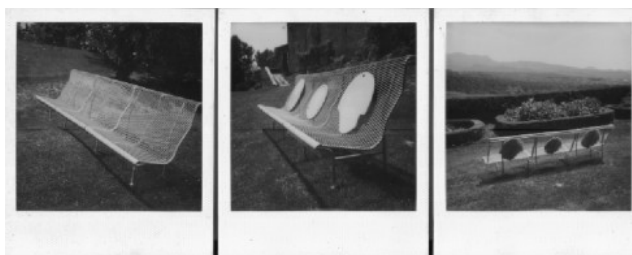
Jordi Mitjà. Bancs i fragments d'escultures al sol. 1992. 3 Polaroids.