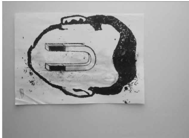
Pep Duran. Dibuixos Imantats, QUAM 1998.

l'aportació de visions dissidents i projectes mutables i adaptables a l'espai i al temps. «L'espai urbà, les ciutats contemporànies, són enteses com a llocs que responen a les característiques canviants i fluides que vertebraren la identitat dels seus habitants, llocs de llibertat i convivència que vertebraren tots els sectors socials i grups per minoritaris que aquests puguin ser».