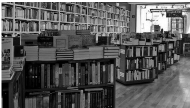
Imatge: A Sabadell, La Llar del Llibre va ser una de les llibreries que va resistir la crisi.