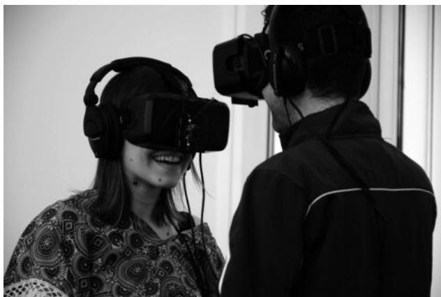
Durant el festival es van proposar altres maneres de gaudir del cinema.