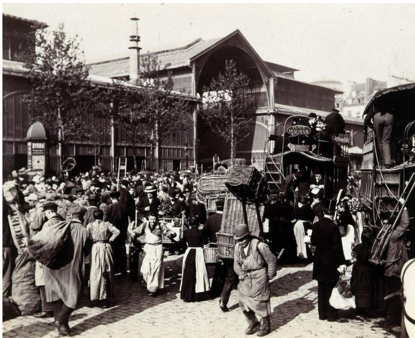
Figura 4 – Les Halles em Paris, Disponível em: http://www.histoire-image.org/site/etude_comp/etude_comp_detail.php?i=749&id_sel=1328. Acesso em 20 de setembro de 2013.

sinônimo de que a cidade assumia ares de modernidade 19 e o Rio, como a capital da república brasileira, não poderia estar em descompasso em relação às nações mais avançadas.