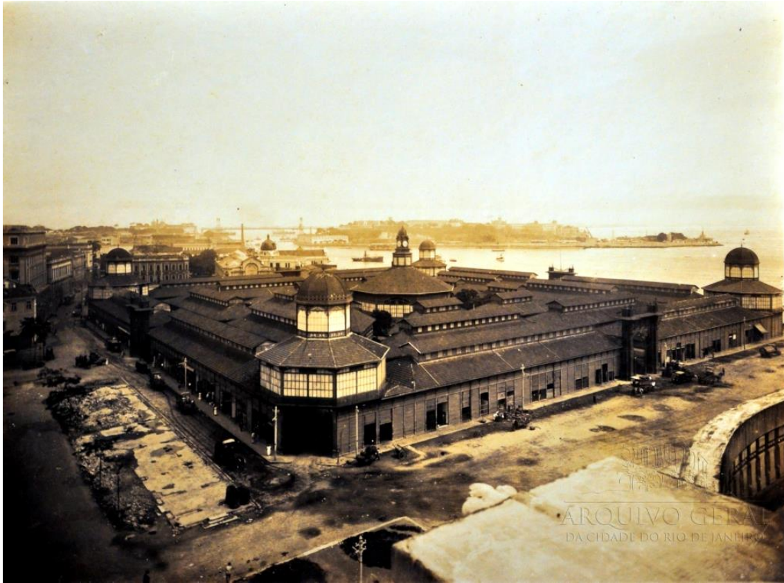
Figura 3 – Panorama do Novo Mercado Municipal do Rio de Janeiro (1907).

A euforia da edição do Almanaque Garnier 18 diante da inauguração mostra-nos a expectativa e interesse pela construção “superior a 22.000 metros quadrados”, projetada pelo engenheiro Azevedo Marques e composta de “quatro portões monumentais pesando cada um 35.000 kilos”, e quatro torreões “com andar superior envidraçado” além do dominante torreão central onde “estão instaladas as câmaras frigoríferas em número de quatro” “é, sem contestação, um grande melhoramento entre os muitos de que, nos tempos recentes, tem sido dotada a Capital da República”.