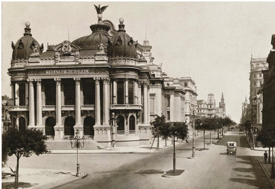
Figura 1 – A imponente Avenida Central e os edifícios da reforma promovida por Passos. Rio, João do. Livro do Theatro Municipal do Rio de Janeiro . Rio de Janeiro: Photo Musso, 1913, p.11.

Oswaldo Porto Rocha (1995) ao investigar as obras de remodelação da cidade intitulou o período como a “era das demolições”, e certamente essa expressão foi muito feliz ao conseguir definir com bastante propriedade as desapropriações arbitrárias e muitas vezes injustas promovidas durante a gestão de Francisco Pereira Passos.