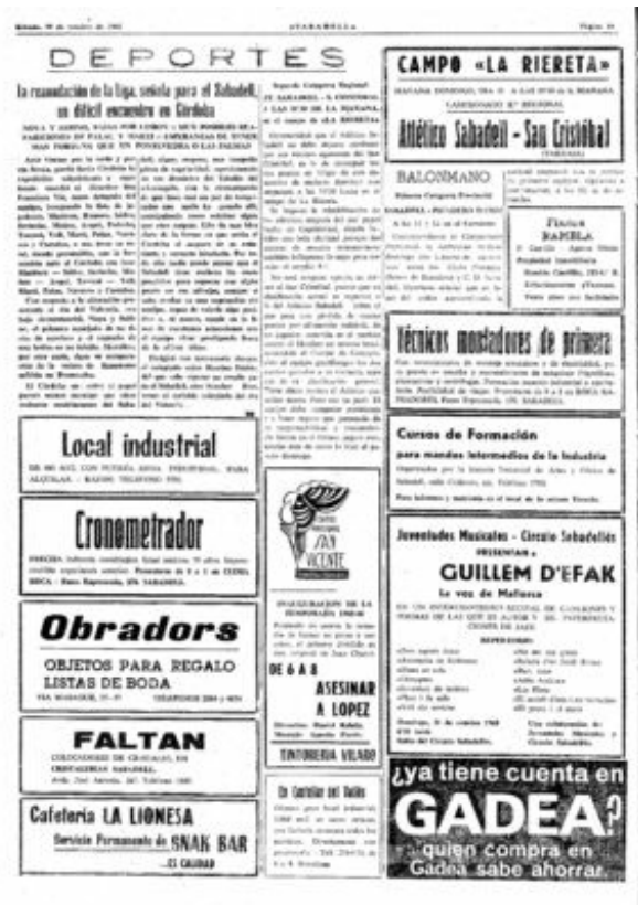
Imatge: Diari Sabadell del 30 d'octubre de 1965. Publicitat del primer concert oficial de Guillem d'Efak a Sabadell.

podia ser representat. El document original es troba a l'arxiu de la Joventut de La Faràndula.