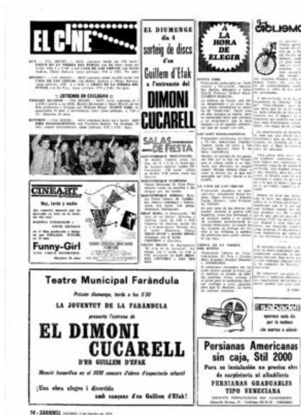
Imatge: Diari Sabadell del 2 de febrer de 1973. Publicitat de l'estrena de l'obra de Guillem d'Efak El dimoni cucarell al teatre La Faràndula.

A Can Puigjaner són pobres en néixer i quan moren més. A Can Puigjaner quan se mor un vell neixen tres infants tan pobres com ell. A Can Puigjaner quan ploren les dones mai aclariràs si s'ha mort un home o ha nat un infant. A Can Puigjaner si et canses de viure