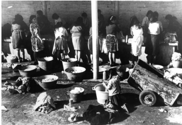
Imatge: Safareig col·lectiu, 1967. Arxiu Històric de la Mina i del Camp de la Bota.

un futur digne i a llarg plaç. Totes aquestes persones, a causa del preu dels habitatges, van acabar vivint en petites casetes, moltes de les quals eren barraques, del Camp de la Bota, que s'amuntegaven als voltants del castell de les Quatre Torres.