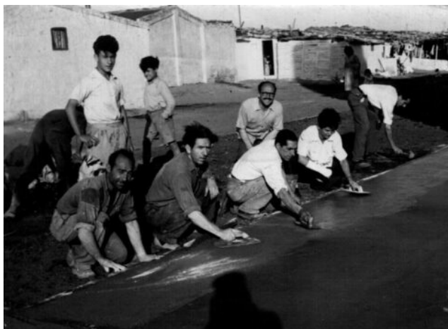
Imatge: Fent els carrers de Pequín.

Monferrer repassa l'arxiu de fotografies digitalitzades, ordenades en carpetes, obre cada imatge sabent què hi trobarà i avança una explicació perquè coneix cadascuna de les fotos, dels protagonistes que hi apareixen i sap (i relata) com van arribar a l'arxiu. Des de les imatges de primers del segle XX quan La Bota encara recordava episodis de la guerra de la Independència d'un segle enrere i els soldats francesos anaven a fer pràctiques de tir a la zona més deshabitada de la ciutat, el Delta del Besòs.