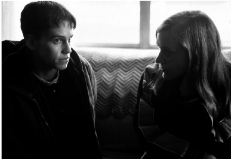
Imatge: Escena de la pel·lícula Boys dont' cry.

que un nen intersexuat tingués un cromosoma Y —que se suposava suficient per a la masculinitat social— per concloure que hauria de ser criat com a noi. Brenda va passar a ser una altra vegada David i va començar a viure com un noi als 14 anys. Se li va implantar un fal·lus entre els 15 i els 16 anys que li va permetre cert plaer sexual, orinar a peu dret, però limitant algunes de les funcions que s'esperaven d'ell, la qual cosa va fer que David entrés en la norma masculina només de forma ambivalent. Va acabar suïcidant-se.