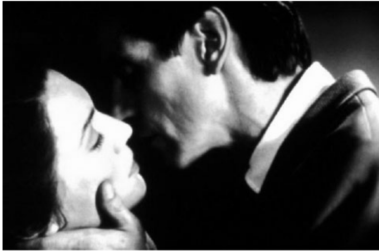
Imatge: Escena de la pel·lícula Madam Butterfly.

Quan en l'Amèrica profunda, on es desenvolupa aquesta pel·lícula, els amics de la noia que està amb Brandon i que la pretenen sense que ella els correspongui descobreixen que Brandon, el seu rival, és en realitat anatòmicament una noia, la colpegen salvatgement i la violen, en una barreja de sentiments, que van des de la venjança i la humiliació perquè la noia que pretenien hagués preferit aquest personatge ambigu que van prendre per un noi i pel perill que representa aquesta transgressió a les normes imperants en gènere i sexualitat. Violar suposava per a ells «col·locar-la al lloc que li corresponia pel seu sexe anatòmic».