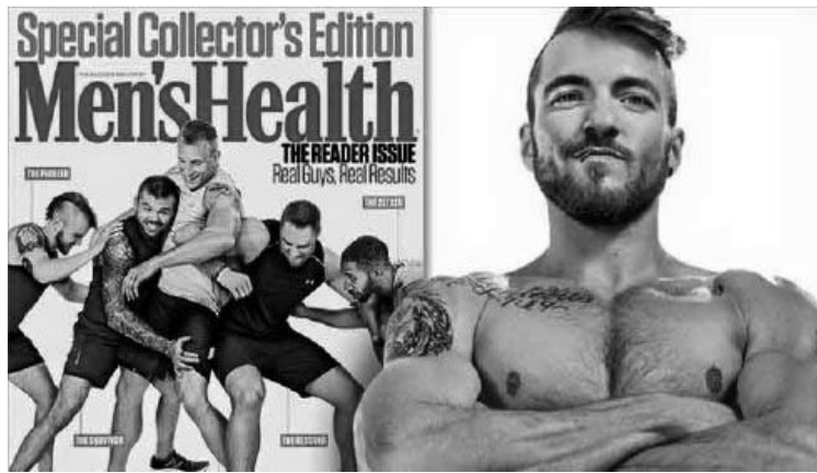
Imatge: Ayedian Dowling, transsexual masculí, model de portada de la revista masculina Men's Health.