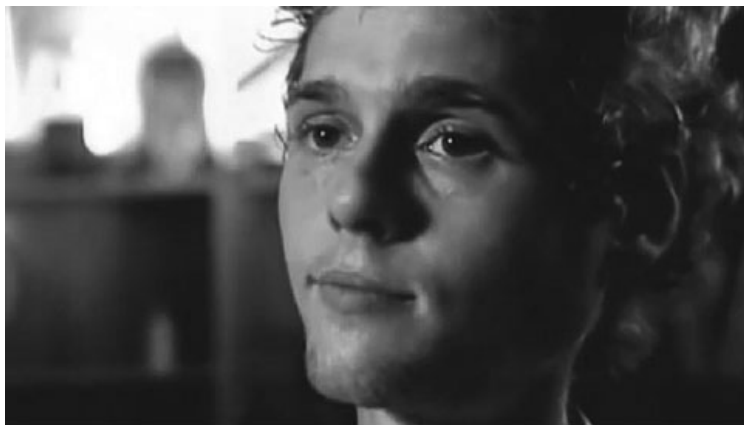
Imatge: David Reimer, imatge documental sobre la seva vida a la BBC.

Aquest pensament és bastant discutit pels corrents constructivistes que sostenen que el gènere és una adaptació a un estil d'identitat proposat en principi pels primers cuidadors i després reforçat per la cultura a la qual es pertany. Aquest estil, però, varia en diferents contextos socials. Per posar només uns exemples de com les identitats genèriques poden ser molt flexibles: a Indonèsia tenen un nom per descriure aquells subjectes en els quals la seva anatomia i la seva identitat de gènere no concorden entre si. Per exemple, distingeixen cinc gèneres flexibles: la