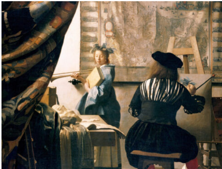
Imatge: L'art de pintar, Johannes Vermeer.

Fou Niklas Luhmann qui caracteritzà la modernitat com un procés de construcció i diferenciació d'un conjunt de «sistemes parcials autopoiètics», organitzats al voltant d'una funció específica i autònoma. Afegí, a més, que cada un d'aquests sistemes observava la societat des de diferents punts de vista: el sistema polític per una banda, el sistema econòmic, per una altra; el sistema de la ciència, el sistema educatiu, el sistema de l'art i així, successivament. Uns sistemes que, al seu torn, també es poden subdividir en unitats encara més específiques 2 . Com que cada un d'aquests sistemes parcials observava la «realitat» des d'una perspectiva determinada, la societat moderna hauria estat incapaç de descriure's a si mateixa des d'un únic centre o punt d'Arquímedes. Luhmann afegia que la igualació de tots els sistemes feia que, a diferència de les anteriors societats, especialment les «dogmàtiques», a la societat moderna no pogués existir-hi cap certesa absoluta, concloent o privilegiada —a pesar del domini recent del llenguatge economicista i la ideologia empresarial 3 .