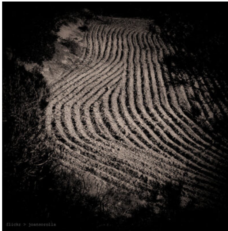
Imatge: Camp llaurat.

Alguns autors sostenen que fins al segle XVIII els historiadors tenien clar que el seu treball estava relacionat tant amb el temps com amb l'espai (o, si es vol, tot i els matisos que cada un dels següents termes té amb el territori, el lloc o el paisatge). El saber històric, com a «ciència general de l'experiència», formava part de la història natural, la geografia i la cronologia. Tot i l'obra de geògrafs importants com els germans Humboldt, Karl Ritter o Friedrich Ratzel, que havien fet un gran esforç per destacar la «constitució espai-temporal» de les històries empíriques, sota els efectes de la filosofia de Kant i Herder, cada vegada més la geografia es convertí en una «ciència de l'espai», mentre que els historiadors optaren per donar rellevància al temps 12 . Curiosament, això succeïa de forma més o menys simultània a la gran partició que establia Lessing en el llibre Laocoonte o sobre els límits de la pintura i la poesia (una vegada més els límits!); aquest cop, entre la pintura i l'espai per una banda, i la poesia i el temps, per una altra. D'ara en endavant, l'espai dels historiadors passava a ser un mer escenari o decorat on tenia lloc l'acció humana; i la geografia, una «ciència auxiliar» sense rellevància. Així doncs, la geografia esdevenia una ciència sense profunditat, estàtica o morta: un «mapa sense vida», hauria dit Ritter 13 .