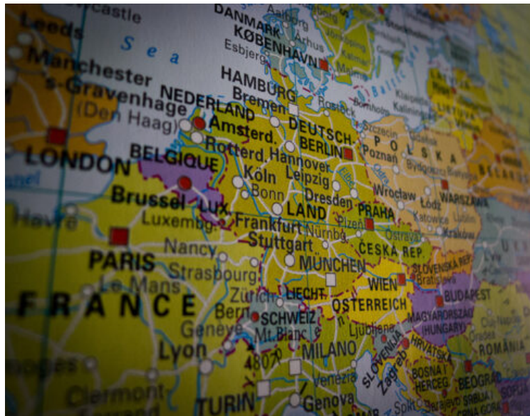
Imatge: Fragment Mapa d'Europa.

Un d'aquests conceptes ha estat l' espai . A pesar de les justes advertències de Reinhart Koselleck, que es queixava del fet que encara no existís una «història conceptual» de l'espai, el cert és que aquest ha estat un dels termes més traduïts recentment; no només en el camp dels estudis culturals sinó en el conjunt de les ciències socials i humanes 8 . De fet, és un concepte tan present, ja sigui des del punt de vista analític com metafòric (recordem que la primera activitat enguany de la Festa Major de Sabadell portava per títol «Mapping de Joan Oliver»), que des de finals dels anys vuitanta i principis dels noranta es parla d'un veritable «gir espacial» de les ciències socials i humanes. Fins i tot en el si de la geografia —concebuda com a «ciència de l'espai» des de l'època de Kant, com tindrem ocasió de comentar més endavant—, es parla recursivament de «gir espacial» 9 . També en el terreny dels estudis literaris existeix un interès recent per l'espai; i ens trobem amb la mateixa situació en el camp de la teoria política 10 . Per la