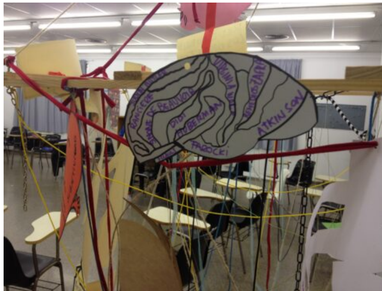
Imatge: "Radiografia grupal d'interessos", assignatura pràcticas de corporización y pedagogías de contacto curs 2016 al màster oficial Artes y Educación: un enfoque constructorista, Facultat de Belles Arts Universitat de Barcelona.

3.- El gir teatral: emfatitza el rol oblidat del cos, posant en escena la importància de les pràctiques de corporització i l'ús de conceptes «teatral» per comprendre les actuals formes de configuració identitària. En els estudis de performance, els punts de força es distribuïran més cap a la discussió sobre l'encarnació del discurs, la representació, la identitat encarnada, l'anàlisi de les estratègies a través de les quals opera el poder (performance-performativitat), la recerca de tàctiques de resistència i polítiques i estètiques d'experimentació, l'etnografia i l'etnodrama, el teatre de l'oprimit i la performance com a pràctiques polítiques..., i l'abandonament gradual del teatre i la reivindicació de la performance com una pràctica política, o l'interès pels rituals socials, etc. Aproximacions com el Nou Materialisme ( New Materialism ) o la teoria no representacional han contribuït a canviar l'enfocament des de la representacionalitat i l'hegemonia del llenguatge i la significació en les nostres comprensions de les pràctiques discursives (amb un predomini del postestructuralisme i la deconstrucció), cap a processos materials i encarnats de producció de coneixement.