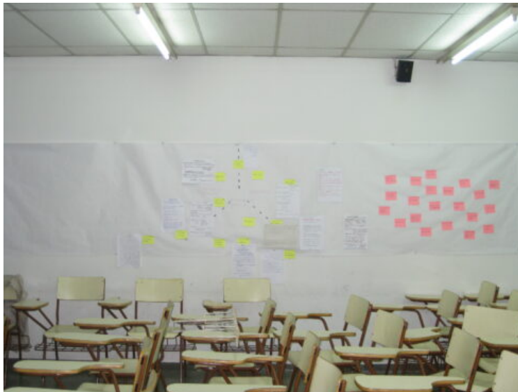
Imatge: “Cartografia d’agents en el context cultural i artístic”, assignatura Sociologia de l’Art curs 2009 Facultat de Belles Arts Universitat de Barcelona.

Les diferents hibridacions dels camps del saber en aquesta crisi del coneixement però també social i política (amb les revoltes estudiantils, feministes, de negres, gais, lesbianes i transsexuals), i de revisió acadèmica, es va anar generant i discutint durant anys en diferents espais: en centres d’art, al carrer, universitats, però també especialment en revistes especialitzades ( October, TDR-The Drama Review... ). La necessària hibridació i problematització tant dels «objectes» d’estudi com de les metodologies i marcs teòrics, va portar a una hibridació que generà tres «girs culturals»: