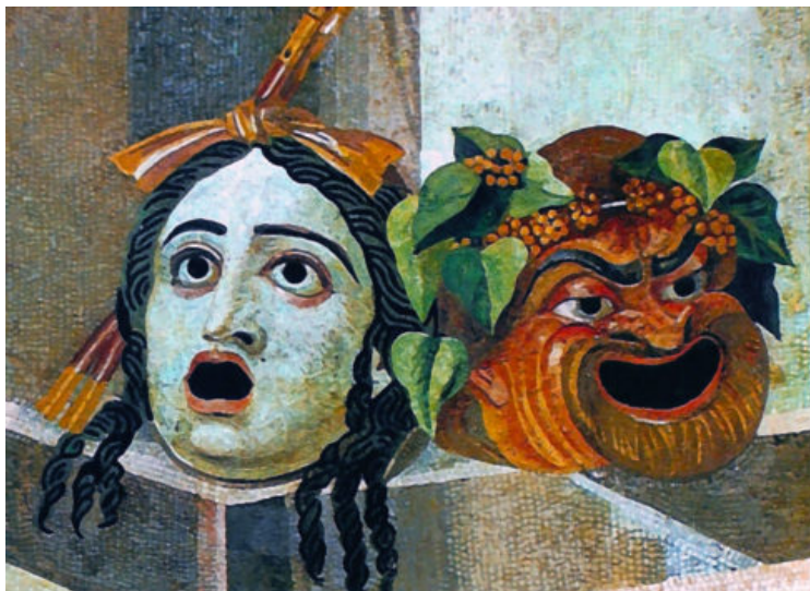
Imatge: tragèdia i comèdia.

La idea de classificar les arts en gèneres aparegué per primera vegada a la literatura europea fa uns 2.400 anys, concretament al principi del tercer llibre de La República de Plató. La majoria d'enciclopèdies, de manuals pedagògics i d'articles online ho remarquen, però no semblen sorprendre's davant d'aquesta troballa: la classificació de les arts en gèneres va néixer en un laboratori polític. No hi fan cap referència precisa: citen Plató en general, més com un segell d'autoritat que com una clau per entendre la funció dels gèneres en l'art. La qüestió superficial de qui va inventar el concepte sembla més important que la qüestió profunda de per què el va necessitar. Com si el fet que els gèneres artístics hagin nascut com una eina política fos un detall secundari.