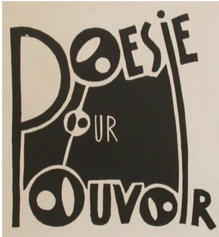
Imatge: Michaux, "poesia per poder".

El criteri que sembla més adient a Plató per classificar les arts és el de la imitació , per dues raons. Primera, la imitació és un criteri educatiu per excel·lència: decidir en cada cas què es pot imitar i què no equival pràcticament a plantar el marc del programa educatiu més adaptat a cada classe social. La segona raó és que li permet jerarquitzar totes les arts entre elles, i dins les arts, totes les obres, i dins les obres, els diferents elements, en funció d'una escala que podríem dir d' autenticitat (les arts més imitatives: pintura, poesia lírica, creen il·lusions i són perilloses. Plató les situa a baix de l'escala). El que importa aquí és que la intenció primera de la classificació de les arts és la de jerarquitzar i censurar: els gèneres artístics neixen com a eina de política educativa dins l'obra d'un defensor de l'oligarquia, i tenen com a finalitat imposar, per sobre de la lògica pròpia de la creació, una lògica de reproducció de l'ordre social. Sent així, no és d'estranyar que la relació entre els artistes i la classificació genèrica hagi sigut sempre complicada.