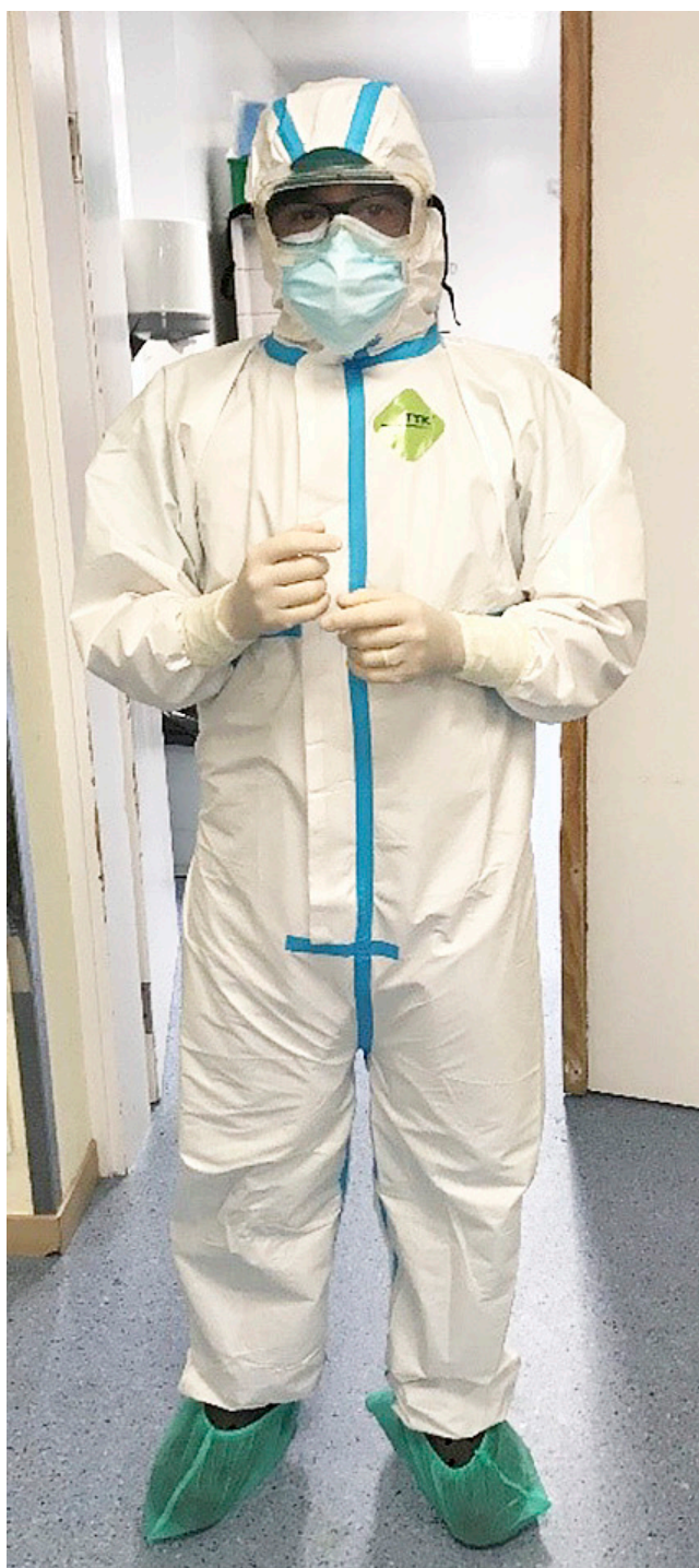
Figura 5. Profesional con EPI previo a la realización de angioplastia primaria en paciente en código infarto con sospecha de COVID-19.

En la figura 5 podemos observar un profesional con la opción del mono impermeable con capucha, protección ocular ajustada de montura integral, doble guante, máscara autofiltrante FP3 y por fuera máscara quirúrgica.