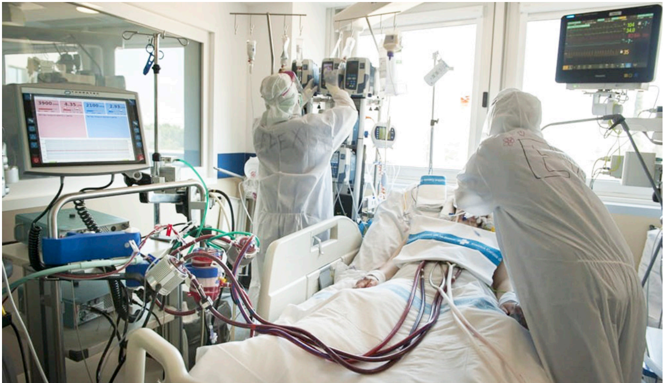
Figura 2. Enfermeras cuidando a un paciente portador de asistencia ventricular Levitronix ® , tras haber sido portador de ECMO ® venoarterial con COVID-19, de la Unidad de Cuidados Intensivos Cardiológicos del Hospital Universitario de Bellvitge.