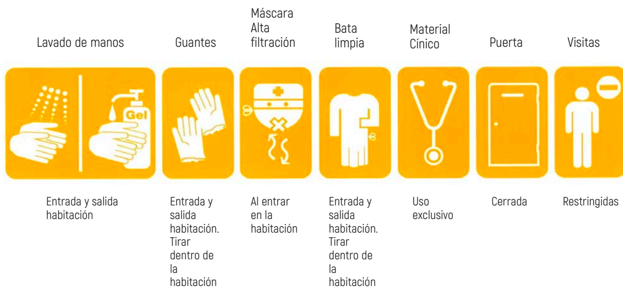
Figura 3. Medidas de aislamiento para evitar la transmisión por contacto y aire.

Pese a que la vía de transmisión del COVID-19 es por gotas, el tiempo que estas partículas quedan en suspensión cuando se genera algún aerosol o en superficies es mucho mayor que el resto de coronavirus conocidos 15 . Por este motivo, los equipos de protección individual utilizados son aquellos indicados para la transmisión por contacto y aire. No se debe olvidar que estas medidas siempre se aplicarán siguiendo las precauciones estándar. Se recoge un resumen en la figura 3 .