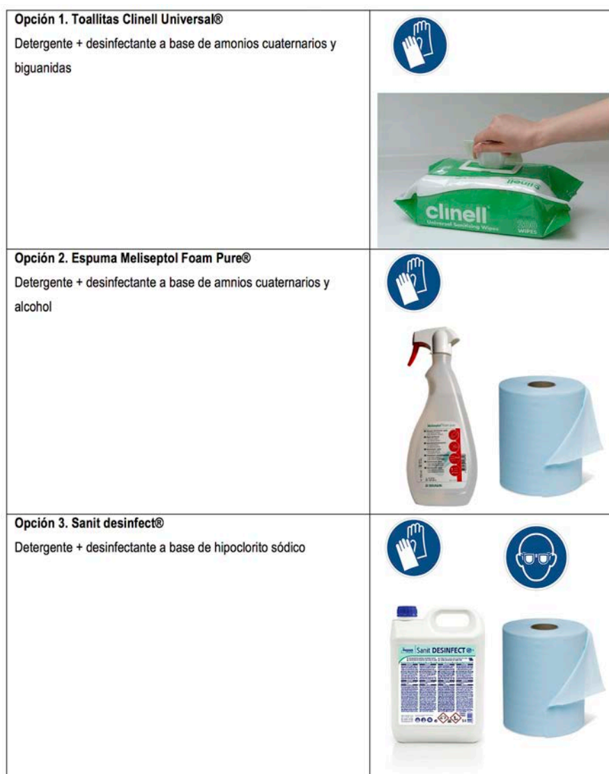
Figura 4. Tipos de desinfectante para la limpieza y desinfección del material clínico reutilizable.

· Siempre que se pueda, disponer a los pacientes en habitaciones de presión negativa. El sistema de ventilación debe garantizar presión negativa en el interior de las habitaciones con respecto al pasillo y áreas próximas, y asegurar seis recambios de aire por hora (RAH). El flujo de aire estará correctamente dirigido en el interior del cuarto y la evacuación del aire se hará en el 100 % al exterior. Si es necesaria la recirculación del