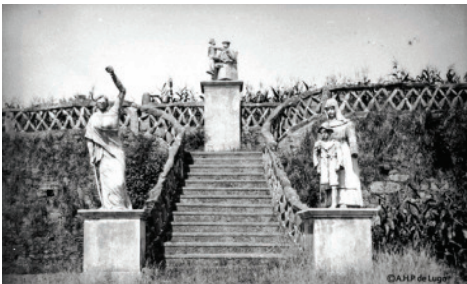
Fig. 38.- Restos das estatuas da Despedida de don Juan.