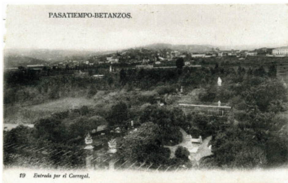
Fig. 11.- Panorámica da parte baixa do Pasatempo ca Estatua de Mercurio en primeiro termo e a Estatua da Caridade e dos Irmáns García Naveira no fondo.