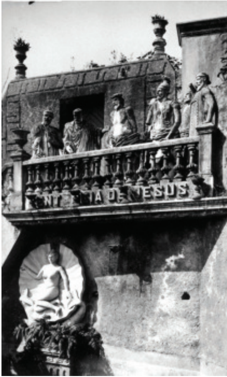
Fig. 33.- Loty. Sentencia de Jesús. AHP Lugo.