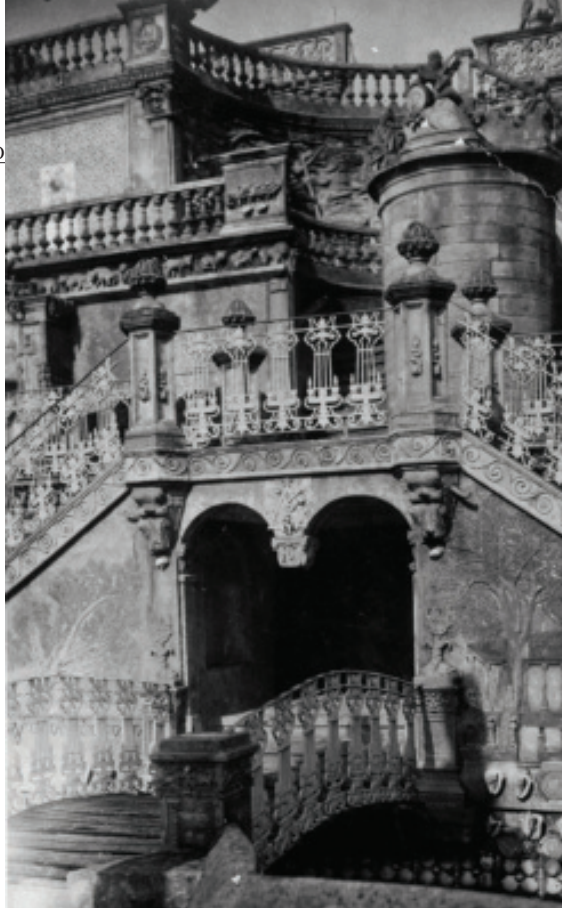
Fig. 15.- Loty. Detalle do escudo masónico do Estanque do Retiro. AHP Lugo.

cóncavos e convexos, a semellanza da Casa dos Espellos, para representar un xogo habitual nas loxas masónicas e que terá que ser unha idea que manteñamos durante toda a ruta: o noso progreso, o noso avance, unicamente terá un inimigo e non será outro que a nosa propia persoa, por iso cómpre vernos e coñecernos dende todos os ángulos posibles para saber a que nos imos enfrontar. Presidindo este punto estaría un obxecto, entre dúas columnas, que podemos asegurar que foi dos poucos que desapareceu intencionadamente nos anos da Guerra Civil Española ou nos primeiros anos da posguerra. Tratábase dunha decoración que chegou aos nosos días grazas a ser retratada polo fotógrafo Charles Alberty Jeanneret Loty (Rodríguez, 2015a: 439) (Vázquez Rey, 2018) e na que se admiraban varios relevos claramente identificables por calquera profano ca masonaría: a escuadra, o compás ou a pirámide, combinado con outros como a estrela de cinco puntas (Rodríguez, 2015a: 426). A evidencia dos símbolos foi de seguro a motivación que levou a facelos desaparecer, deixando ante os nosos ollos decenas de símbolos que ante a falta do coñecemento necesario non puideron eliminar, porque a realidade iniciática está sempre velada e para descubri-la, para poder desvelar ese segredo masónico, hai que experimentar os símbolos e o ritual, sendo esta a única maneira de revelar o que agocha.