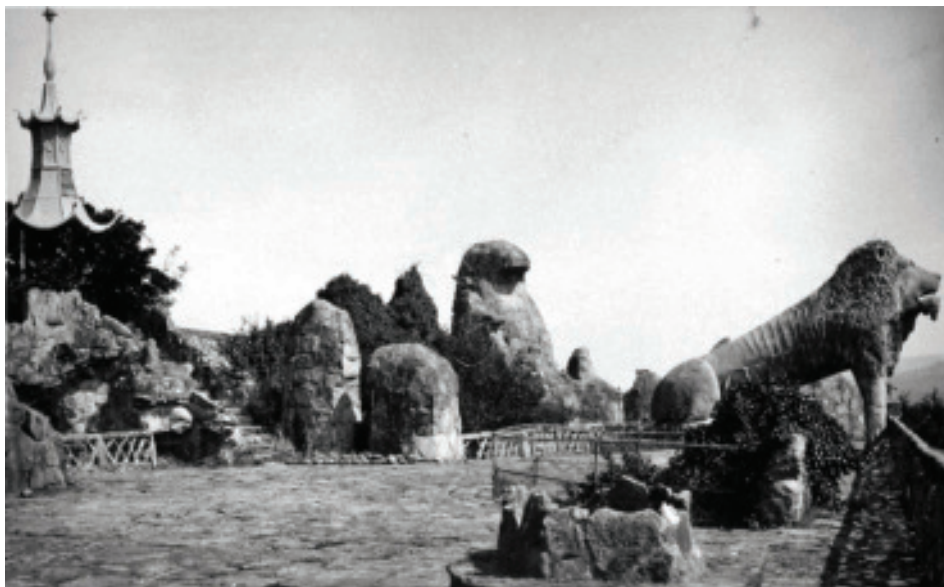
Fig. 36.- Loty. Terraza do mestre, co León Colosal, o pozo e o miradoiro. AHP Lugo.

Pasatempo irán descendendo as referencias artísticas á par que van medrando os nosos coñecementos-: