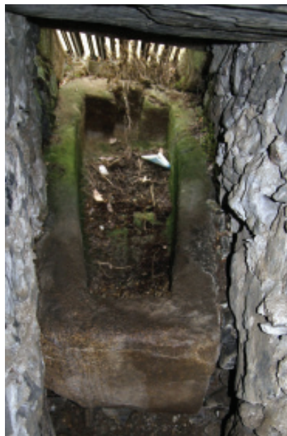
Fig. 24.- Cadaleito no interior das covas.