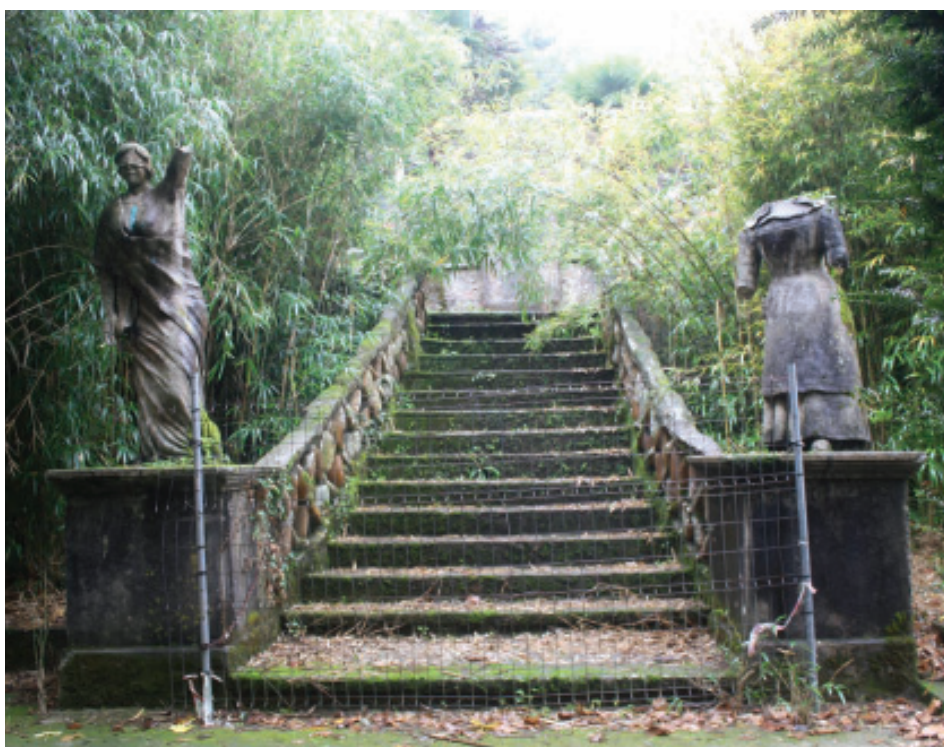
Fig. 39.- Loty. Estatuas da Despedida de don Juan. AHP Lugo.