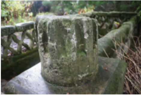
Fig. 37.- Columna quebrada ao comezo da Despedida de don Juan.