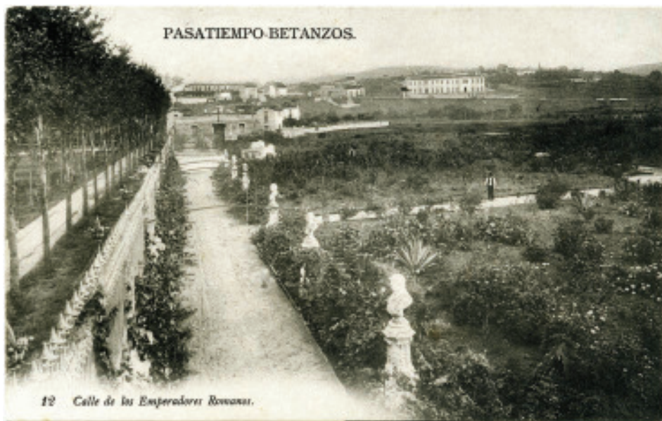
Fig. 7.- Postal da Avenida dos Emperadores ca Casa Taquilla e a Entrada dos Leóns no fondo.

Esta, xunto á Fonte das Catro Estacións, son das escasas referencias que aínda manteñen o seu emprazamento orixinal, quedando totalmente desvirtuada por carteis publicitarios, edificios deportivos e demais equipamentos. Si que houbo un intento de traslado 15 , primeiramente ao Parque Pablo Iglesias e logo á Praza do Concello (Vales Vía, 2012: 261-262), pero problemas administrativos e queixas eclesíásticas paralizaron en varias ocasións o proxecto.