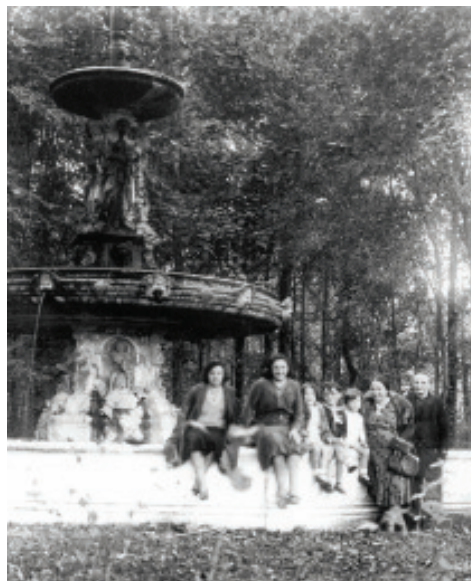
Fig. 9.- Foto de grupo diante da Fonte das Catro Estacións.

Seguindo as testemuñas da época hai que facer referencia a un zoolóxico que existiría no Pasatempo, non sabemos se na parte baixa ou ao final da parte alta, algo que acontecería tamén ca existencia dun suposto labirinto vexetal. O caso é que temos numerosas excursións