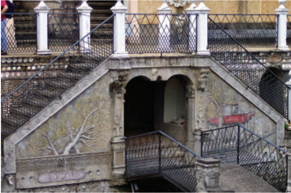
Fig. 13.- Árbores do Estanque do Retiro.

charco que deixaron. No lado contrario, a árbore de Guernika, o carballo que dende a Casa de Xuntas de Guernika representa ás liberdades do pobo vasco. A significación destas dúas imaxes pode gardar relación cas futuras leccións que agardan por nós no Pasatempo, centradas na transcendencia e nas liberdades das que falará Juan García Naveira, pero parece remitir tamén a un dos primeiros pasaxes da Biblia, a das árbores do paraíso.