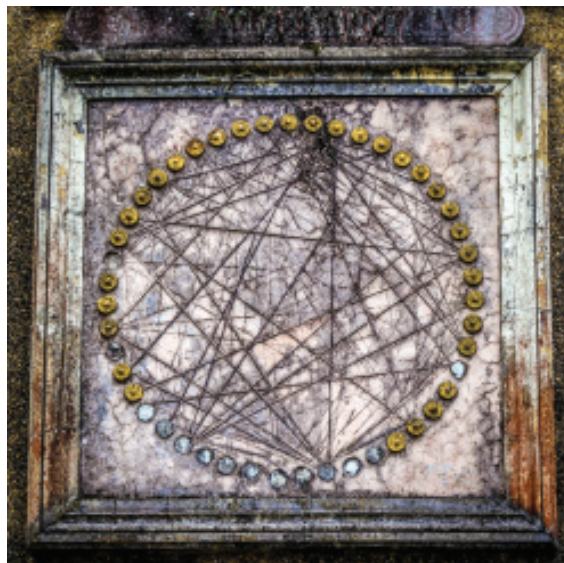
Fig. 18.- Detalle do relevo La paz por el arbitraje.

Este é o único relevo que conta cun texto que lle dá título, neste caso La paz por el arbitraje. Nel aparece representado un círculo feito á súa vez por 49 pezas circulares, unidas entre si por liñas que van dun lugar a outro. Se temos en conta que este muro é posterior a 1903 hai que contextualizalo nesa época previa ás grandes guerras, onde diversos colectivos non buscaron a confrontación e a violencia, senón todo o contrario. Houbo nacións que chegaron a pactos e acordos de paz, de non agresión, o que Juan García Naveira quixo poñer de manifesto neste recuncho do Pasatempo, potenciando unha idea que como veremos co paso dos anos acabaría fracasando. Esta é ademais unha das mostras máis importantes da relación entre o Parque do Pasatempo e a masonaría, xa que a Institución del Tribunal de la Paz ou o Tribunal del Arbitraje serán considerados descendentes directos do movemento masónico (Enríquez, 1995: 246) como así se demostrou nos diferentes encontros internacionais nos que participaron todo tipo de colectivos, dende loxas masónicas a partidos políticos.