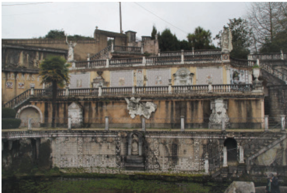
Fig. 30.- Muro dos Azulexos entre as Estatuas da Liberdade e da República.

axudar ao compañeiro masón a comprender o verdadeiro significado das relixións e a procurar a palabra perdida en cada unha delas. Non hai que esquecer que unha das condicións para poder ser iniciado na masonaría é a da necesidade de crer nun ser superior, o que eles posteriormente chamarán Gran Arquitecto do Universo.