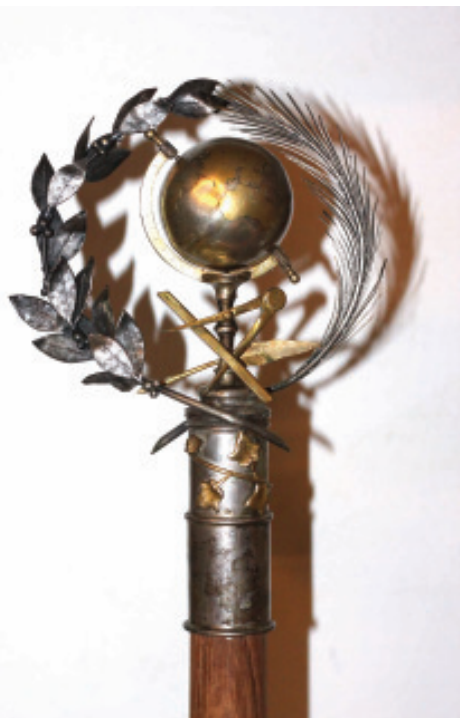
Fig. 3.- Cimeira masónica da bandeira das Escuelas García Hermanos . Museo das Mariñas.

A seguinte terraza, a do Muro das Viaxes 13 , será a que se corresponda cos coñecementos do compañeiro masón, mentres que a terraza do León Colosal, unha das imaxes máis