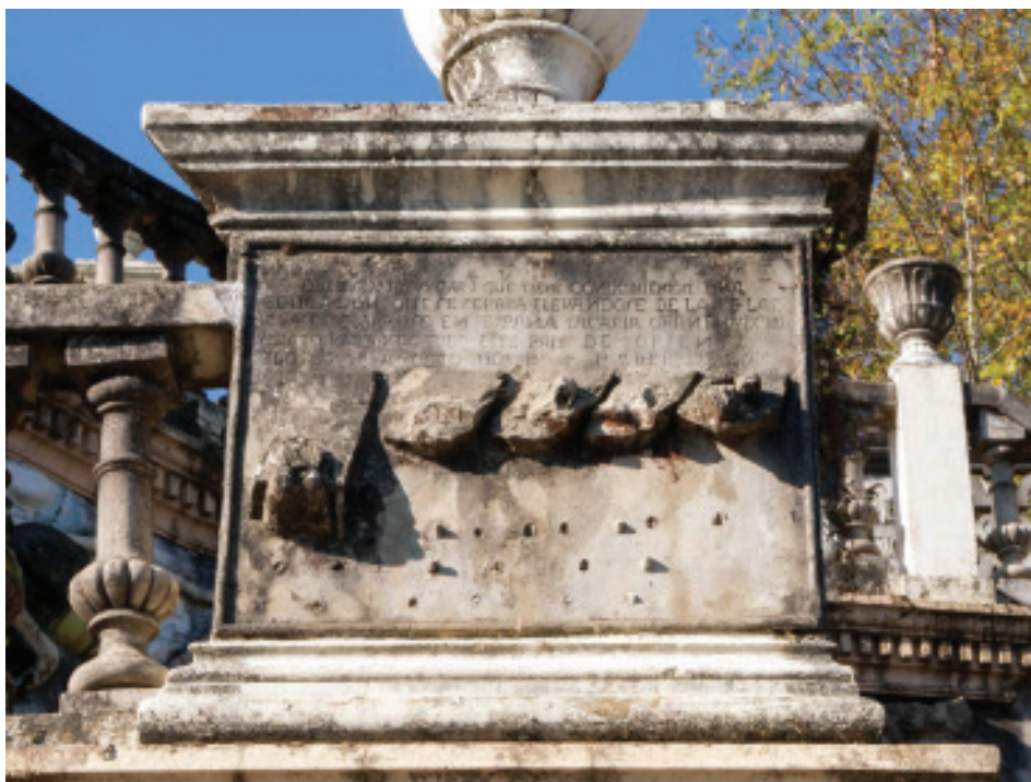
Fig. 19.- Relevo do País de Oriente.