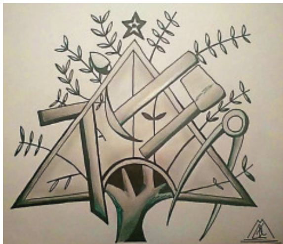
Fig. 14.- Daniel Lucas Teijeiro Mosquera. Representación do escudo masónico do Estanque do Retiro.