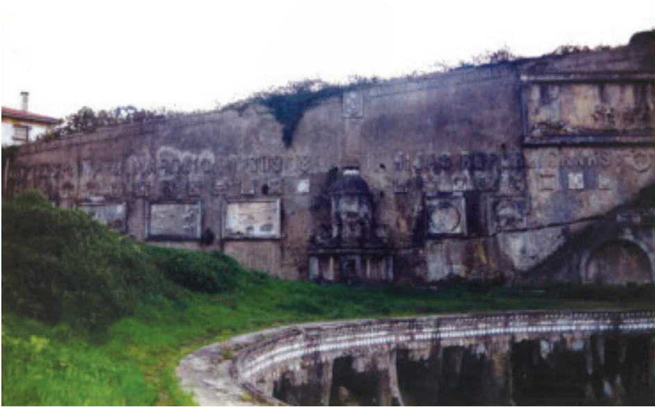
Fig. 17.- Panorámica do muro da España Monárquica y sus 18 hijas republicanas.