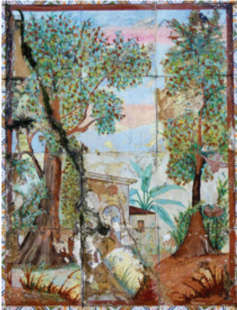
Fig. 29.- Detalle dunha das imaxes simbólicas do Muro dos Azulexos.

- A legalidade fai referencia á aceptación por parte da loxa de todo o ordenamento xurídico que emana da vontade do pobo, estando prohibido o posicionamento na súa contra. O obxecto que se emprega para isto é o da rosa, que simboliza a iniciación nos misterios da masonería e a rexeneración. Aparece representada en varios cores, incluso no morado que é a único cor prohibida nunha loxa, sendo tamén un tributo aos templarios e aos rosacruces, ordes segredas intimamente relacionadas ca masonería.