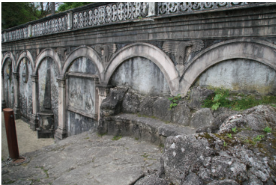
Fig. 28.- Águias bicéfalas ao redor dun dos relevos de Martín Fierro e da Pirámide de Maio.