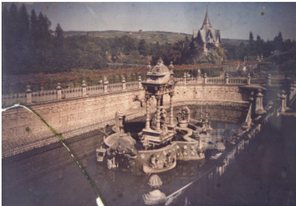
Fig. 12.- Estanque do Retiro co desaparecido Pavillón de Recreo ao fondo.

Este percorrido tería que empezar no banco que rodea o interior da illa do templete, sobre o mosaico que forman as figuras mariñas e que tería que estar regado polas numerosas fontes que decoran este lugar. A auga que chega ata aquí e que brotará de todas as fontes do parque terá sempre a mesma orixe, o Estanque de Salomón, do que falaremos máis adiante, no seguinte nivel. Mais o brote de auga máis portentoso deste inicio sería o representado pola parella de danaiades, fillas do rey Dánao castigadas a encher de por vida un cántaro de auga sen fondo.