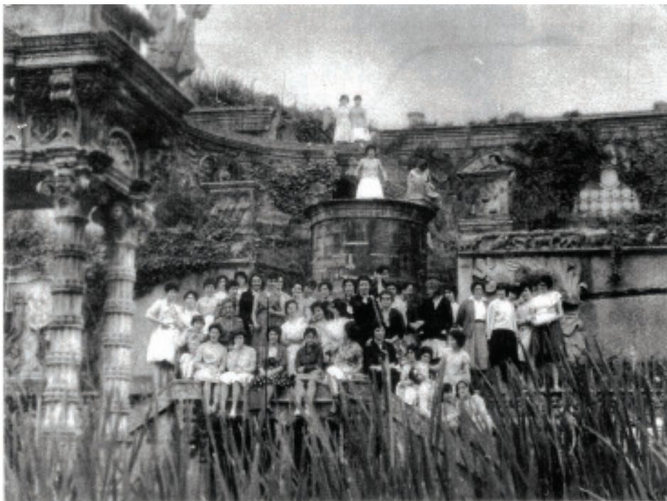
Fig. 5.- Grupo de mulleres visitando o Parque do Pasatempo nos seus anos de abandono.

localización comezaría na Casa Taquilla, xusto ao cruzar a ponte do Carregal que atravesaba o río Mendo; e remataría no antigo Pavillón de Recreo, esa estrutura de aires orientais que permitía entrar á parte alta do Pasatempo a todo aquel que tivera accedido pola zona inferior.