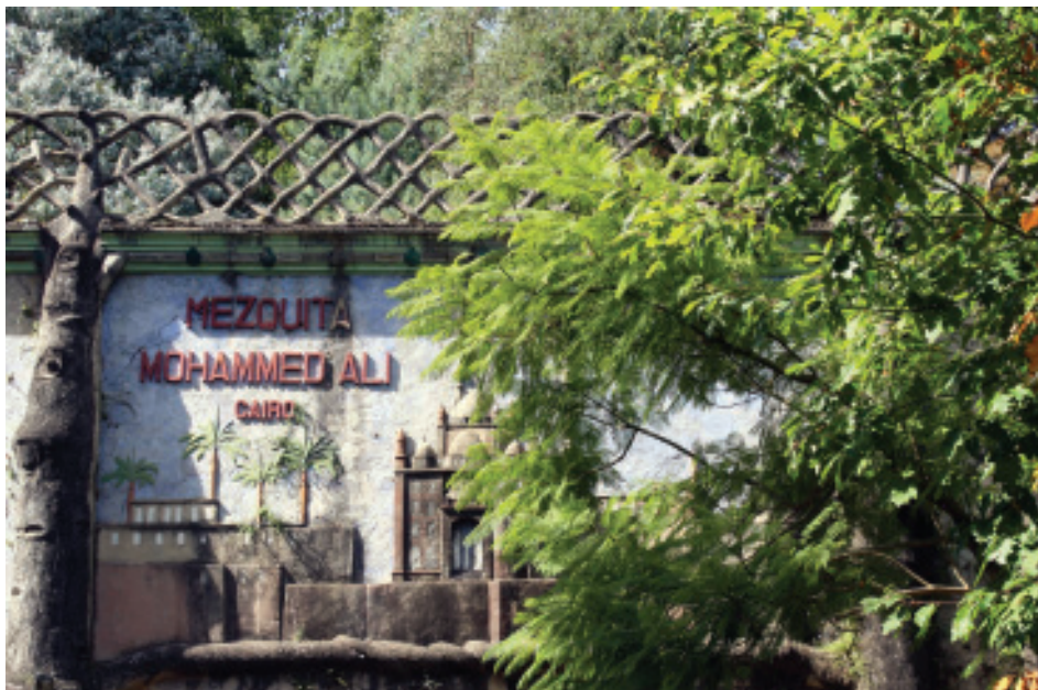
Fig. 35.- Muro das viaxes dividido polo tronco de cedro libanés. Arquivo AAPP.