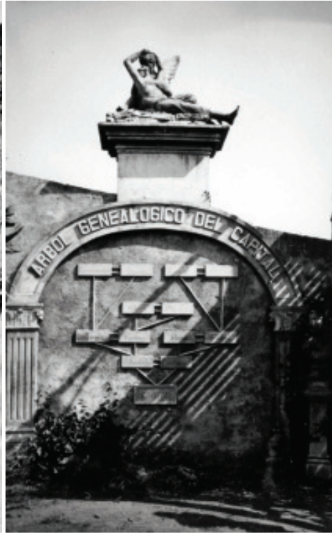
Fig. 34.- Loty. Árbol del Capital. AHP Lugo.