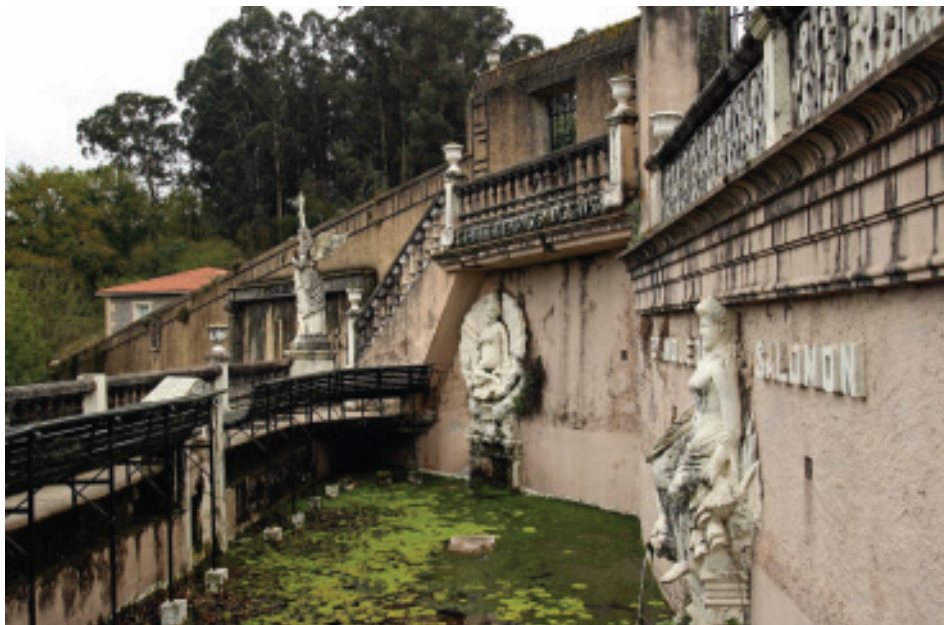
Fig. 32.- Estanque de Salomón e Sentencia de Jesús.

través de tres fontes, das que unha delas contará ca decoración dunha ninfa ataviada ca faciana dunha das fillas de Juan García Naveira.