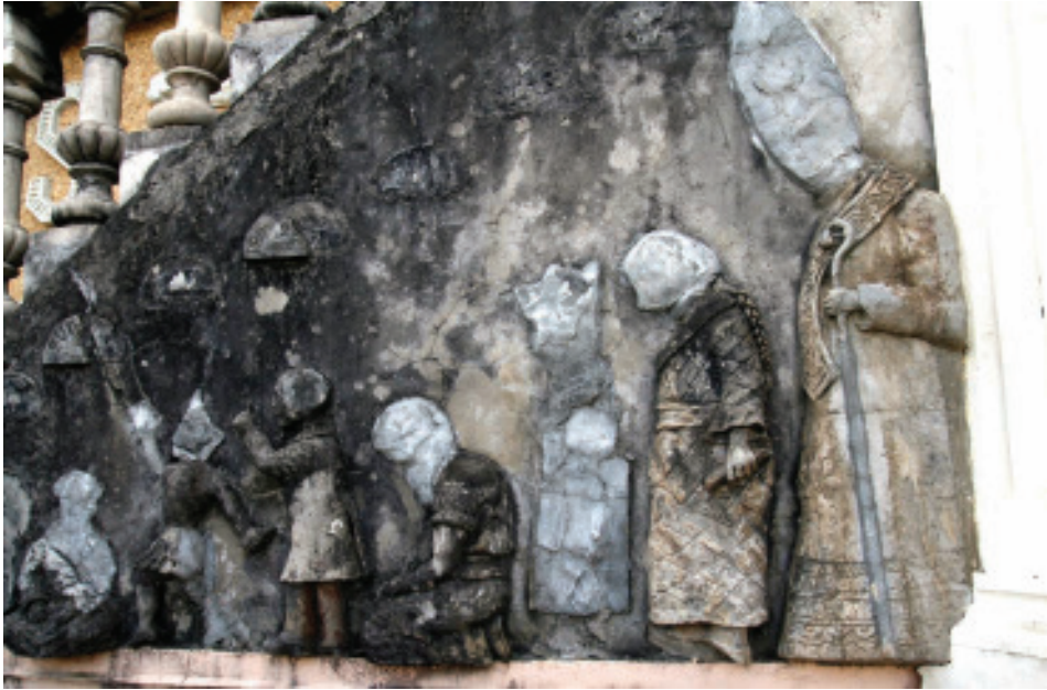
Fig. 31.- Detalle do Muro das Relixións. Arquivo AAPP.

viaje de la tradición de los compañeros, una larga peregrinación en la que el nuevo obrero se ponía en camino para adquirir aquí y allá nuevos conocimientos. Es el grado de la búsqueda del saber y del descubrimiento del mundo” (Ferrer, 1996b: 62). Para poder pasar da regra á escuadra ou da perpendicular ao nivel, que son os cambios que significa ascender ao segundo nivel, o aprendiz terá que realizar cinco viaxes 20 simbólicas (García; Terrones, 2018: 14) (Martínez, 2009: 92-93) que estarán ocultas neste nivel do Pasatempo, especialmente no chamado Muro das Viaxes, principal protagonista desta terraza, pero no que atoparemos dous conxuntos escultóricos máis: