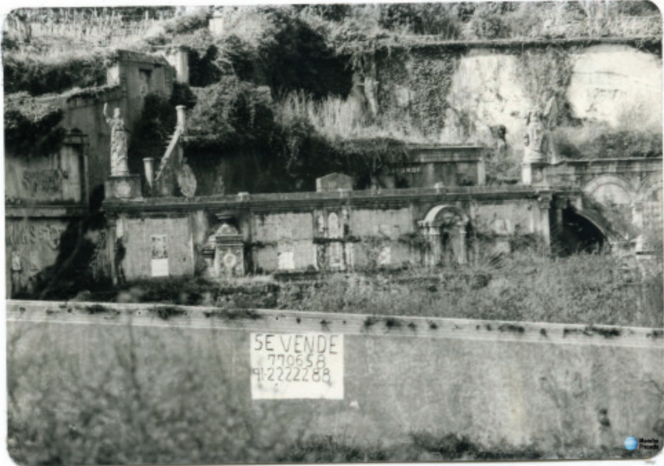
Fig. 4.- Vista xeral do Parque do Pasatempo nos seus anos de abandono. Arquivo AAPP.

simbólicas do parque brigantino, será a que acubille os coñecementos que ten que adquirir todo mestre masón.