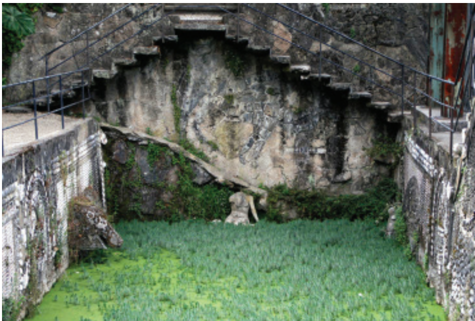
Fig. 20.- Decoración do interior do Estanque da Gruta.

Compartimento oscuro de reducidas dimensiones, situado fuera del templo pero, por lo general, cerca de la puerta de éste. Su finalidad consiste en que el profano, a la luz de una vela, escribe su testamento filosófico y reflexiona sobre el acto iniciatorio que va a realizar.