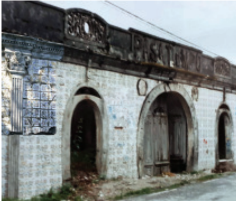
Fig. 6.- José Souto. Reconstrucción sobre os restos da Casa Taquilla de parte do muro que aínda non se conserva no parque.