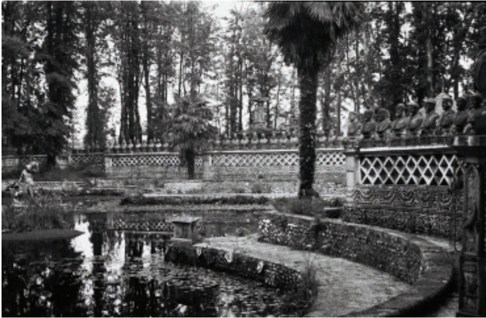
Fig. 10.- M.Chamoso Lamas.Estanque dos Papas ca Fonte das Catro Estacións.

que quedan impresionadas con especies como os lobos, os monos ou as aves de diferentes procedencias. Cóntase tamén que Alfonso XII regaloulle un varias bestas dos seus cotos reais a Juan García Naveira, destacando a figura dun iac que non sobreviviu durante moito tempo ao clima do Pasatempo, aínda que é algo do que ata o momento non existe proba documental que así o certifique.