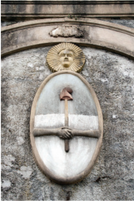
Fig. 27.- Escudo do Muro de Arxentina con simboloxía masónica.

nación arxentina. Na unión dos arcos aparecerán o resto das provincias arxentinas nun letreiro co seu nome e o da súa capital e unhas aves con trinta e tres plumas, mirando cada unha para un lado. Pódese tratar dunha alegoría das aguias bicéfalas que miran ao pasado e ao futuro, sendo ao mesmo tempo o símbolo do Supremo Consello do Grao 33 do Rito Escocés Antigo e Aceptado, o que nos faría intuír que a relación do maior dos Naveira ca orde segreda chegaría ata os niveis máis altos aos que pode optar un masón.