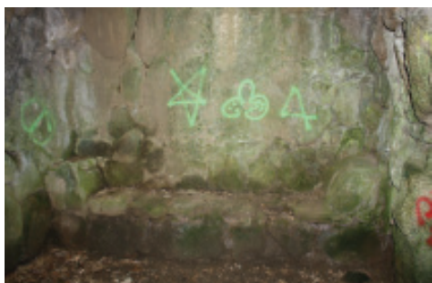
Fig. 25.- Banco no interior da Cámara de Reflexión.