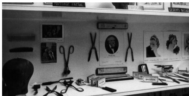
Foto: Dues de les poques imatges de l'exposició «Grandfather», Berna, 1972.

Les mares que són les àvies ho van passar a les mares que són les filles que ho van passar a les filles que seran les mares. Un poder. Les mares, les àvies, les filles movent-se en els cercles dels cercles dels anys i dels segles.