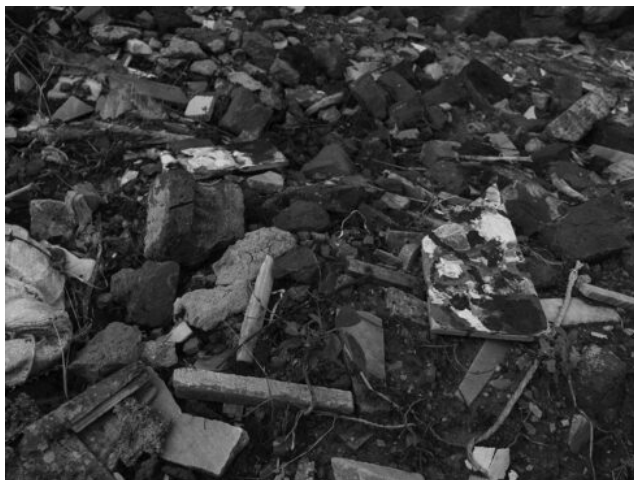
Foto: Fotografia d'un detall que forma part del projecte «Un planeta bañado por la luz en constante erosión, aunque su postura recuerda a un desafío», que Aldo Urbano va realitzar a la residència artística de Sandarbh a la Índia durant el 2014.

El impulso hacia lo místico procede de la no satisfacción de nuestros deseos por parte de la ciencia. Sentimos que incluso cuando quedan respondidas todas las cuestiones científicas posibles, nuestro problema sigue sin haber sido tocado en absoluto. Sin duda ya no queda ninguna pregunta más; y justamente esa es la respuesta.