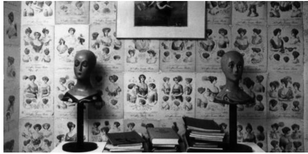
Foto: Dues de les poques imatges de l'exposició «Grandfather», Berna, 1972.

Al capdamunt d'un poble que s'enfila per un turó davant del mar, ens reunim en una placeta davant d'una petita església. És de nit i fa fred, ens posem totes en cercle i elles (1. Elles es refereix al col·lectiu Nenazas ) enmig de nosaltres. Durant una estona pronuncien els conjurs i els encanteris. La lluna ens mira. Soy una bruja soy una bruja soy una bruja. (2 Es tracta d'una performance-ritual que va fer el col·lectiu feminista Nenazas, en el marc del Festival Llucifest a Blancdeguix, el desembre de 2013 al Masnou.). Les campanes de l'església arrenquen a tocar esparverades. Silenci i després riures.