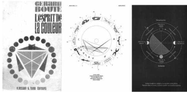
Foto esquerra: Cercle cromàtic a la portada del llibre que em va ensenyar la meva Àvia per estudiar la teoria científica dels colors, L'esprit de la couleur . Foto centre: Dibuix gràfic de la meva carta astral. Foto dreta: Calendari lunar del cicle femení que he trobat a dins del fanzine Brujas que van fer les Nenazas l'any passat .

L'Àvia ha portat un pèndol, és gros i platejat i duu inscrit el nom del Professor Fassman. El pèndol serveix per fer-li preguntes i respon sí, no o que no ho sap. Li pregunto si al nen de la classe que m'agrada també li agrado jo, però no quedo gaire convençuda de la resposta ni de qui és que ha respost.