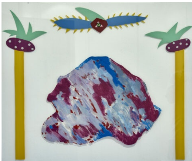
Foto: Silvia Gubern. Piedra sagrada , 1974. Esmalt sobre vidre, 82 x 100 cm.

amb naturalitat amb dues branques més del coneixement humà que també l'interessen: la recerca científica postmaterialista (física quàntica, per exemple) i la recerca espiritual, entenent l'esperit —per dir-ho en les seves paraules— com «un principi que tot ho abraça». (2. Transcripció de l'autora de la conferència de Silvia Gubern «Art, Ciència i Esperit» que va tenir lloc a l'espai d'Art Ruscalleda de Llinars del Vallès, el dissabte 5 de novembre de 2016, de 18 h a 21h.).