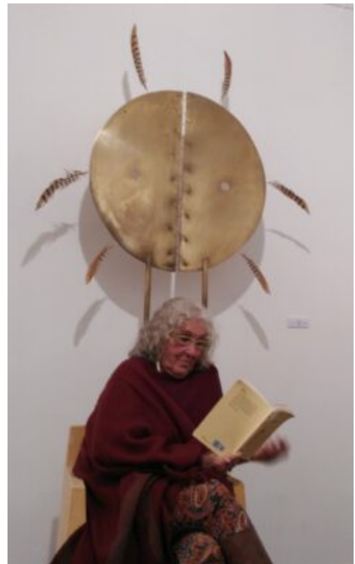
Foto: L'artista llegint un dels seus poemes al final de la conferència "Art, Ciència i Esperit", Espai Rusalleda Art, Llinars del Vallés, 5 de novembre, 2016.

Si podem aprofundir i entendre l'abstracció moderna des d'aquesta perspectiva, per què no començar a parlar d'un conceptual entès com una possibilitat nova per desenvolupar aquesta «utilitat» espiritual de l'art? De fet, només cal que deixem ressonar una de les famosíssimes Sentences on Conceptual Art (1969) de Sol Lewitt per tornar-nos a trobar una definició semblant a la que havia fet Kandinsky: « Conceptual artists are mystics rather than rationalists. They leap to conclusions that logic cannot reach ». Així mateix, una artista actual i coneguda a les pàgines d'aquesta revista, Mar Arza, ens ha assenyalat que, més enllà de la barroera interpretació que s'ha fet de les màximes de Joseph Kosuth (autor d'un dels textos fundacionals del conceptual), el «conceptual» es disposava a l'exploració del misteri de la paraula fundacional, la creadora de realitat. En la seva darrera exposició, Mar Arza assenyalava com va descobrir llegint amb uns altres ulls el famós text de Kosuth que el «conceptual» dirigeix l'artista