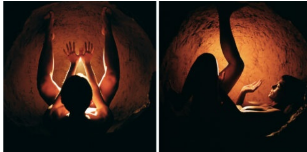
Foto: Sostenibilidad Latente III, V. Sèrie El agua y la tierra originales. Fotografia analògica, 2007. Ramón Casanova, Jorge Egea i Mapi Rivera.

quaderndelesidees.press/el-fenomen-de-la-inspiracio/