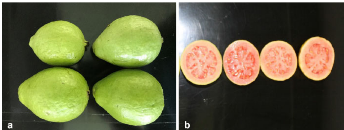
Figura 2. Frutos de guayaba ( Psidium guajava L.) variedad Corpoica Carmín 0328. a) Frutos con madurez fisiológica listos para cosecha y aptos para su consumo, b) corte transversal de frutos.

Corpoica Carmín 0328. Fruta periforme, de pulpa color rojo (Figura 2). Presenta floración múltiple (flores tipo racimo) y un ciclo productivo desde poda de producción a finalización de cosecha de 216 días (7,2 meses). Entre sus ventajas está que el contenido de sólidos solubles totales de esta variedad es de 13,1 grados brix, superando en 21,7 % a la guayaba Pera. La acidez titulable (% de ácido cítrico) de la variedad es de 0,49, lo que le confiere una relación (grados brix/acidez) de 26,7, de esta manera, supera en 12,2 % a la guayaba Pera. Además