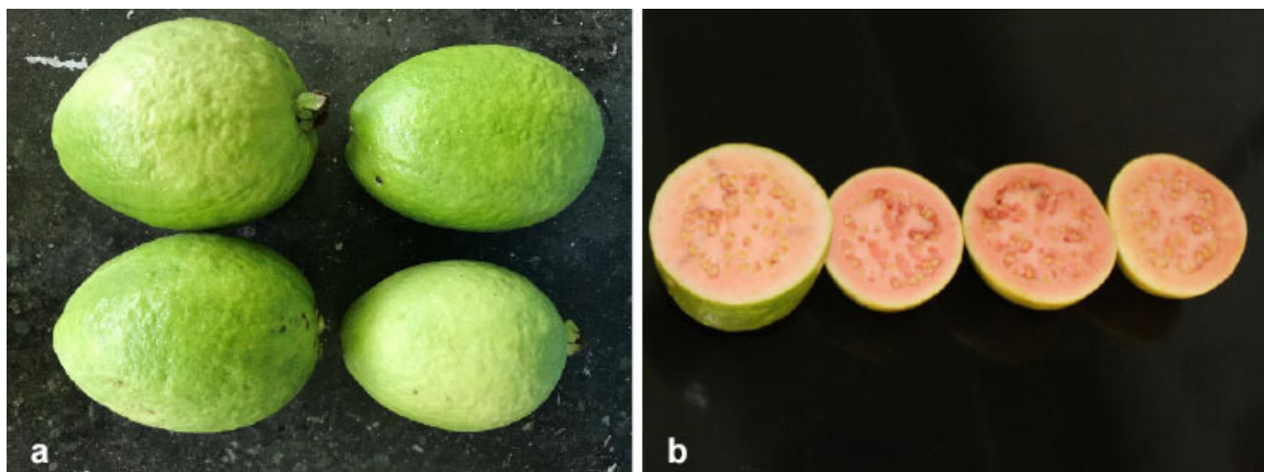
Figura 3. Frutos de guayaba ( Psidium guajava L.) variedad Corpoica Rosa-C. a) Frutos con madurez fisiológica listos para cosecha, y aptos para su consumo b) corte transversal de frutos. Fotos: Claudia Lorena Narváez. Fuente: Corporación Colombiana de Investigación Agropecuaria (AGROSAVIA), Centro de Investigación Palmira, Palmira, Valle del Cauca, Colombia. 2018.

Corpoica Rosa-C. Fruta de forma ovalada con pulpa color rosado (Figura 3). Presenta floración individual. Su ciclo productivo desde la poda de producción a finalización de cosecha dura 220 días (7,3 meses). Entre sus ventajas se encuentra el alto contenido de vitamina C, el cual es de 80,9 mg por 100 g de pulpa, superior en 121,8 % a la guayaba Pera. El rendimiento promedio es de 22,9 t ha -1 de fruta fresca en cada ciclo productivo (7,2 meses), con una densidad de siembra de 333 plantas ha -1 , esta variedad produce en promedio 68,9 kg de fruta por árbol y el contenido de sólidos solubles totales es de 10,8 grados brix (Carabalí-Muñoz et al., 2019).