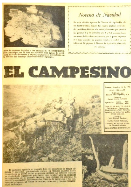
Figura 1. Portada del 14 de diciembre de 1958