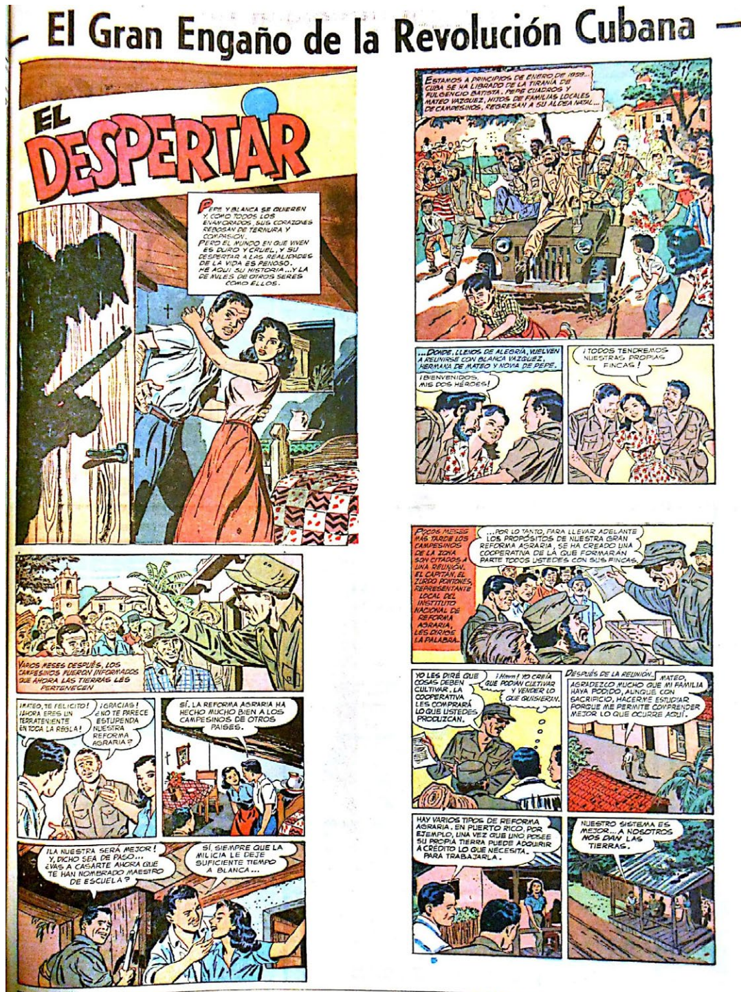
Figura 6. Tira de prensa sobre la revolución cubana del 29 de octubre de 1961