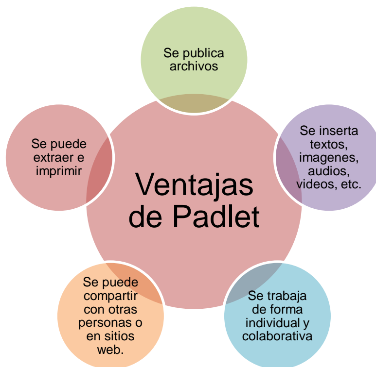
Figura 2. Ventajas de Padlet

Actualmente, es necesario que los estudiantes dominen diferentes tipos de tecnologías para mejorar la comunicación en el aula de clases, el cual, debe ser de calidad y desarrollarse en un ambiente dinámico, por ende, implementar la herramienta Padlet permite a los docentes y educandos recopilar comentarios realizados, de esta forma, indagar distintos aportes que se hayan establecido en la plataforma digital (Pascual, 2019).