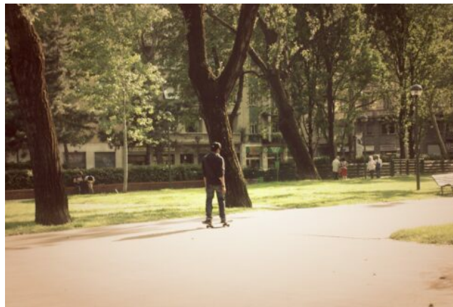
Imatge: Skate de SkyLuke8.

Sempre hi ha lloc per a la possibilitat que les dues espècies visquin en harmonia. Però la història ens recorda que això no és fàcil per causa d'un simple fet de gran complexitat: la condició humana. L'enveja, la impotència, els diners, la superioritat... Hauríem de tenir molta disciplina tots, gent amb monoroda i gent amb peus, per deixar enrere les diferències i tal vegada redactar una nova carta de drets humans per a tots. Els Homo sapiens rodensis serien tan diferents a nosaltres? Seria la seva condició humana essencialment diferent a la nostra?