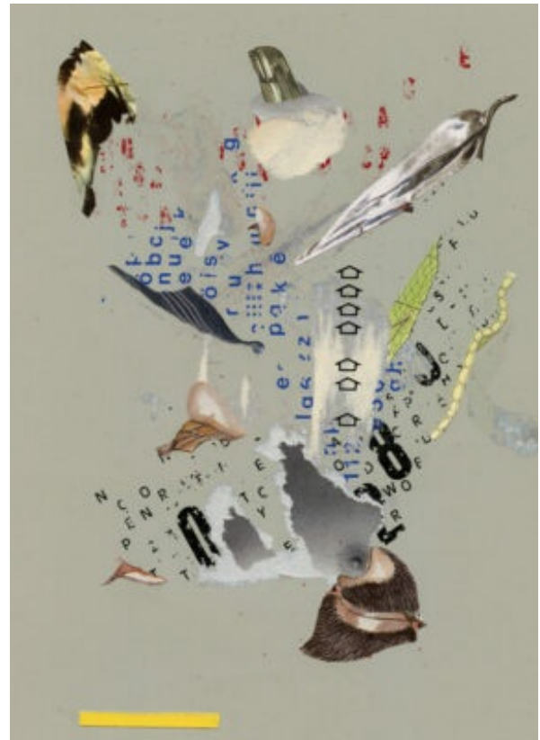
Imatge d'Imanol Buissan.

Acabo aquesta successió de preguntes amb una convicció: en els museus del futur hi hauria d'haver menys conservadors. Ja sé que sembla una astracanada, però el cert és que la institució museogràfica, en el seu delit per preservar el passat, també el passat més recent, com si el pas del temps ni que sigui infinitesimal doti els objectes d'aura