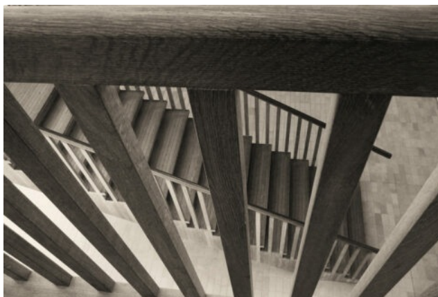
Imatge: Rotterdam detail Museum Boijmans van Beuningen.

Si realment acordem que vivim un «estat d'excepció» (Giorgio Agamben, 2003) i no utilitzem aquest concepte només per a relats filosòfics retòrics allunyats de les reflexions socials o culturals, aleshores els resultats d'aquesta situació d'excepcionalitat fa temps que ja estan a la vista. La violència d'estat ha instrumentalitzat valors de progrés com els que promulgaven les lluites de classes, el feminisme o els drets bàsics de l'humanisme. La nostra societat no només ha perdut els drets fonamentals, sinó que també ha perdut les estratègies per recuperar-los. La manipulació mediàtica és tan enorme i el viratge de les noves tecnologies centrades a reforçar un individualisme cada vegada més egotista és tan brutal que hem de retrobar amb urgència el cos a cos, la participació directa, l'enraonament compartit.