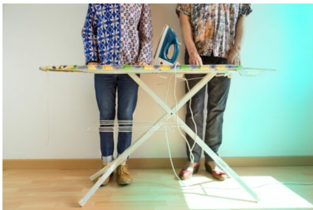
Imatge de Joana Casas Poves, 2020.

amb la cura de persones, del medi ambient i les comunitats. Aquest enfocament té un encaix perfecte entre l'oferta i la demanda social existent a tot el territori, ja que s'adaptaria en funció de les necessitats. Fomentant la força de treball i empleats que desitgen ajudar i contribuir a la societat, s'incrementarien els beneficis rebuts per la gent gran, els infants i les comunitats apartades de la societat, com els migrants. En aquest sentit, un altre concepte al voltant d'aquest tipus de treballs són els green jobs (feines verdes) amb què els treballadors s'orienten a ajudar a sostenir el planeta o preservar el medi ambient. Als EUA hi ha 7,7 milions de joves en atur i, d'altra banda, fa falta plantar milions d'arbres!