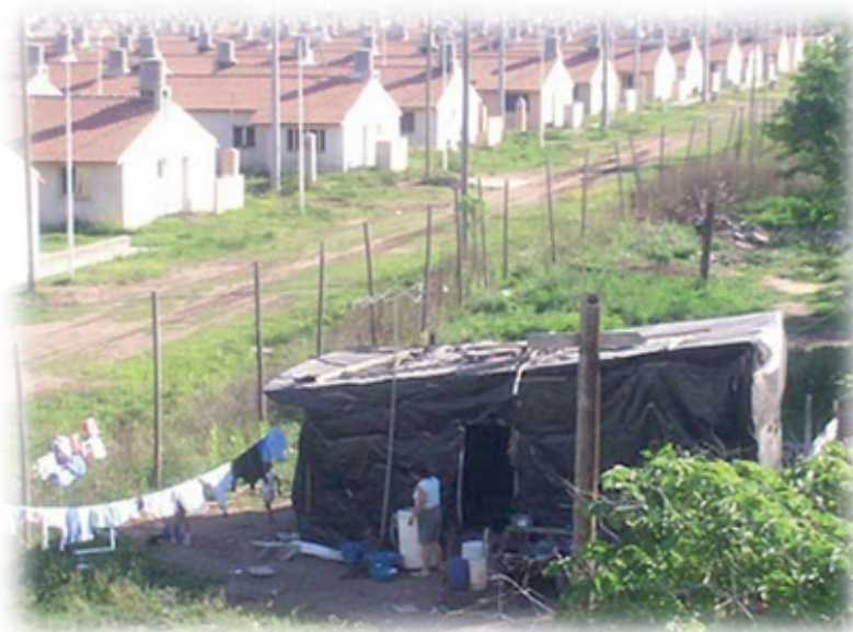
Imagen 3: Barrio San Atilio, José C. Paz (Programa Federal de Emergencia Habitacional Techo+Trabajo)

En estas áreas, debido también a la creciente inseguridad del espacio público, la vida urbana se está restringiendo cada vez más al ámbito doméstico y el espacio público se está volviendo sólo para circular o para quienes deambulan para vivir. Las necesidades económicas, la inseguridad y el error de los planificadores están matando la vida social de estas nuevas territorialidades. El auto encierro se está imponiendo como norma de vida, Sonia Álvarez, reflejando a Marc Auge (1993) señaló: “[...] La modernidad a medias características de estas ciudades no está exenta de soledad. Esta no es una soledad desterritorializada como la de sobre-modernidad, sino fuertemente localizada en una ciudad/no ciudad. Es un no lugar sui generis de la urbanización periférica [...]” (Imagen 3 Pág. 12). Es así como se han extendido considerablemente en los últimos años (2004/2010), las áreas urbanas de baja calidad ambiental y servicios deficientes, grandes manchas urbanas que se caracterizan por insuficientes servicios de transporte, recolección de residuos, luz y agua potable, hasta transformarse su paisaje al grado de haber invertido en algunos casos la vieja imagen que de ellas se tenían. Al respecto Beatriz Cuenya ha señalado que “[...] ya no se tratan de ciudades con estándares de vida más o menos aceptable con algunos bolsones de pobreza, sino de ciudades pobres con algunos bolsones de riqueza” (Cuenya, 1997).