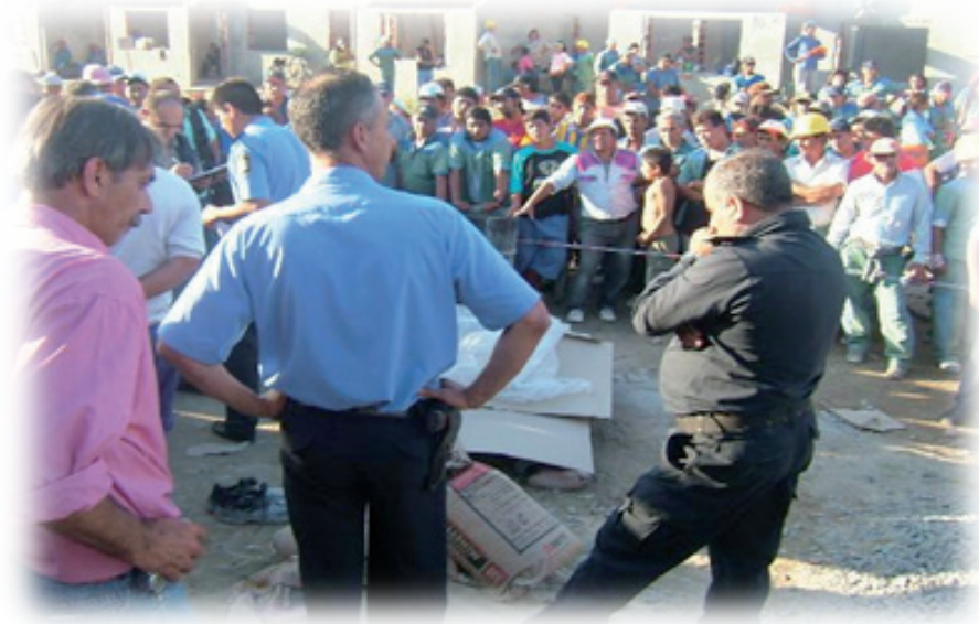
Imagen 4: Homogeneidad arquitectónica, conflictos sociales.

da que nos brinda un vivir en naturaleza y con ella la creación de nuestro ambiente en un respeto de la vida que nos rodea, nos hace parte, nos incluye y a la cual muchas veces excluimos.