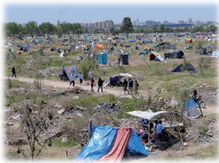
Imagen 2: Ocupación del Predio Indo-Americano, Villa Soldati (año 2010)

Sin embargo, también existen otras, que se producen a partir de acciones políticas de carácter más conflictivas, llevadas a cabo por movimientos sociales de excluidos que reclaman su derecho a la ciudad (Imágen 2, Pág. 9). Este mecanismo de asignación de tierra, sin embargo, en el contexto del acelerado incremento de la población pobre a causa de la migración desde las provincias y los países limítrofes, ha desbordado ampliamente la acción política del gobierno y ha hecho explosión en los dos últimos años en la ciudad.