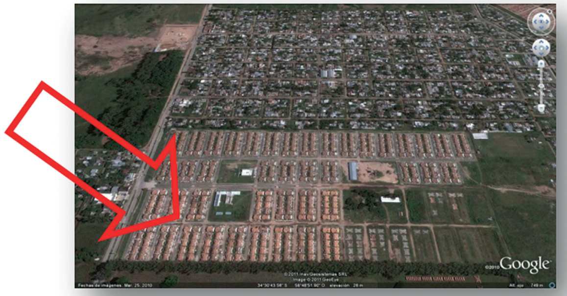
Imagen 4: Barrio Saavedra Lamas, formado por B° Pantaleo y B° Teresa de Calcuta (San Atilio, José C. Paz) Programa Federal Emergencia Habitacional “Techo+Trabajo”

bitacional tan ambicioso que absorbiera a tanta población y que beneficiara a tantas familias, es indiscutible que la fisonomía de José C. Paz ha cambiado y esto se ve reflejado en los hechos y en cómo se van desarrollando. Estamos previendo para la segunda etapa a entregar en el año 2010/11, 1590 viviendas que se encuentran en ejecución por medio del Programa Federal de construcción de viviendas y 704 en ejecución por medio del Programa de Emergencia Habitacional. Estipulándose además el inicio de la construcción de 952 viviendas más para este próximo año que comenzarán a ejecutarse muy pronto. Alcanzándose la cifra de 5586 viviendas construidas hasta la finalización de cada uno de las obras encaradas. [...]”. Fuente: “Punto Cero”, extraído del discurso de la Sra. Intendenta Interina, María L. Geiszer, 6 de abril de 2010.