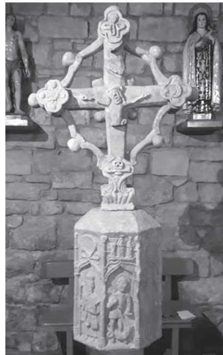
• Fig. 6.- Mestre de Linyola, creu de Bellver de Sió, 1557.