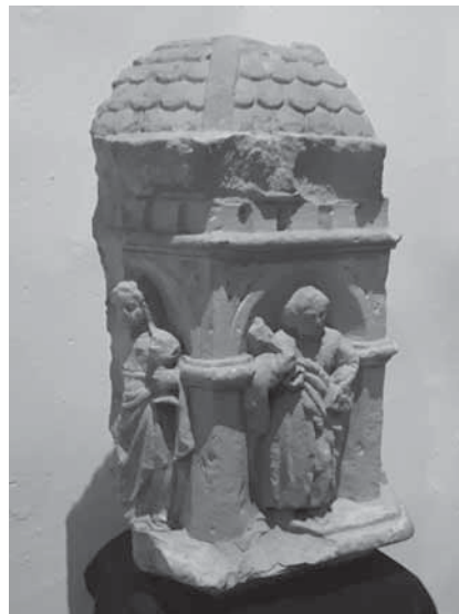
• Fig. 15.- Capitell de la creu de l'Aparició de la Mare de Déu de les Sogues, cap al 1600, església parroquial de Bellvís.

també ens remet cap a les creus de Castellnou de Seana, Anglesola i Sarraí (datades entre 1575 i 1590). Per tant, la creu de les Sogues s'ha de situar en la intersecció d'aquests paràmetres i es podria datar cap a l'any 1600.