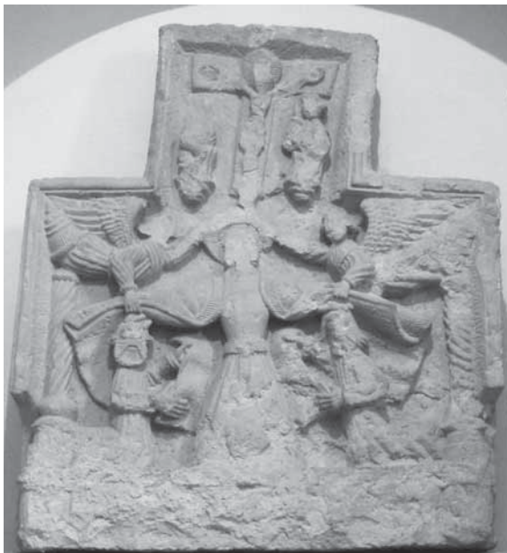
• Fig. 4.- Mestre de Linyola, retaule de Penelles, entre 1530-1540.