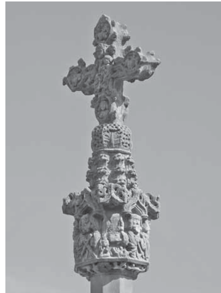
• Fig. 1.- Pasqual de Gaintza, creu d'Hostafrancs, 1517.

L'estil de la creu de terme d'Hostafrancs permet identificar una altra obra atribuïble al mateix escultor, Pasqual de Gaintza, en unes dates properes. Es tracta de la creu de terme de Boldú (l'Urgell), situada a la plaça