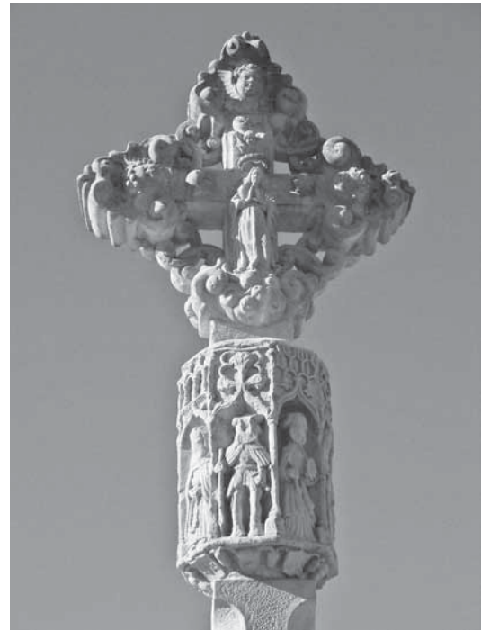
• Fig. 5.- Mestre de Linyola, creu de Castellserà, 1540.