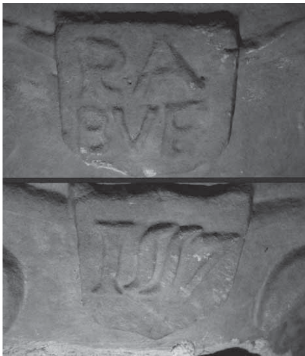
• Fig. 9.- Data i promotor de la creu de Bellver de Sió.

per llaços geomètrics i una flor de lis. D'esquerra a dreta les figures representen diferents sants: sant Miquel matant el drac amb una llança; sant Joan Evangelista amb una copa i una serp que surt d'ella; un sant monjo barbat amb hàbit i un rosari a la mà (sant Antoni Abat?); sant Roc amb una saia curta que s'aparta amb la mà per mostrar les llagues de la pesta també porta bastó i barret; sant Pere amb una clau a la seva mà dreta i un llibre amb les sagrades escriptures a l'altra mà; sant Pau amb una espasa a la mà dreta i un objecte indeterminat a l'altra mà; un sant bisbe amb bàcul i vestit d'ofici; i un sant amb gaiata i barret de pelegrí (l'apòstol sant Jaume el Major). Al collarí inferior del capitell, sota les vuit capelletes amb les figures dels sants, hi ha quatre escuts i quatre caps d'àngel, i, entremig, unes columnes torxades o d'estries helicoidals. En els quatre escuts hi ha quatre anagrames, epigrafia i una data. Els anagrames són IHS (Jesucrist) i MA (Maria). L'epigrafia permet llegir "BISCA / RRI", és a dir, un cognom que s'ha d'identificar amb el patrocinador de l'obra en qüestió; a més, tant en el fogatge de 1497 com en el de 1553, a Castellserà trobem persones cognominades "Biscari" o "Biscarri". I, finalment, una data en la qual es llegeix clarament l'any 1540, una referència inèdita fins ara i que m'estranya que ningú hagués observat (fig. 8).