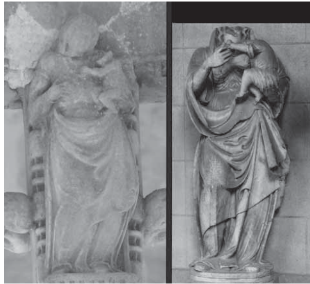
• Fig. 14.- Mestre del Bullidor, detall de la creu del Bullidor; Gil de Medina, Mare de Déu, 1545, Museu Diocesà de Barcelona.

La creu de terme del Bullidor té altres dos paral·lels a les terres de Ponent: les creus de Miralcamp (fig. 12) i Albesa (fig. 13). La creu de Miralcamp és coneguda només pel testimoni de dues fotografies antigues de la dècada dels anys 20 del segle XX fetes per Joan Roig (Arxiu Bastardes) i Josep Salvany (Biblioteca de