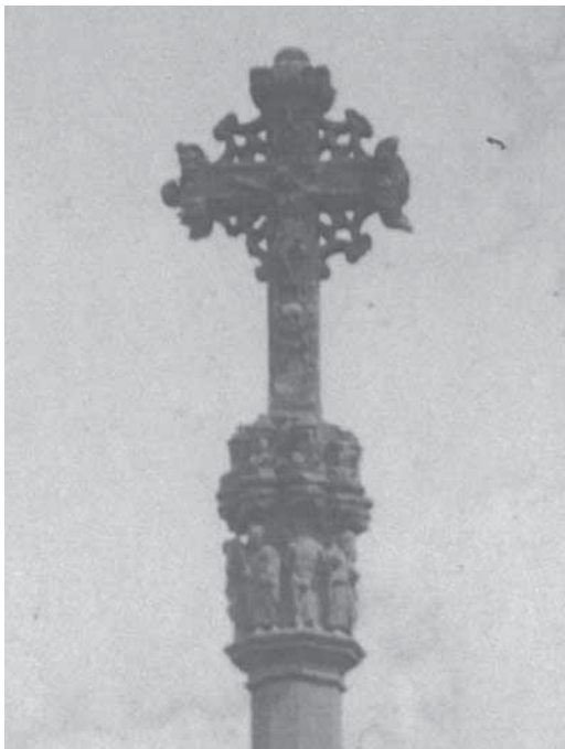
• Fig. 11.- Mestre del Bullidor, creu de Bellvís, entre 1540-1546.