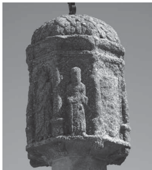
• Fig. 16.- Capitell de la creu de Nalec, 1585-1600.