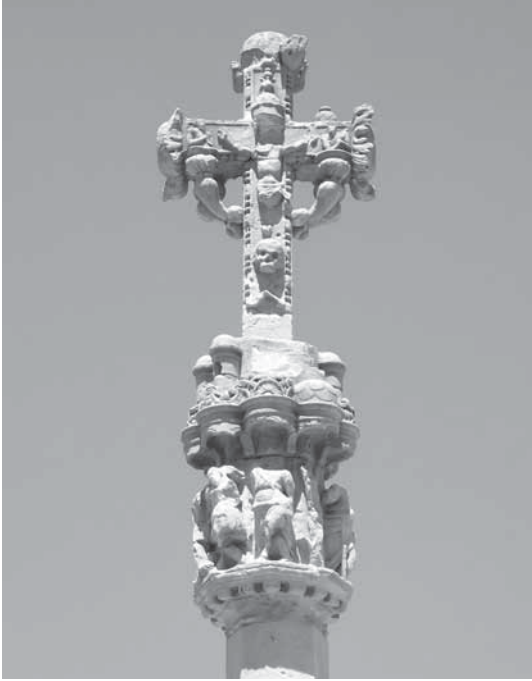
• Fig. 10.- Mestre del Bullidor, creu del Bullidor, 1546, Barbens.