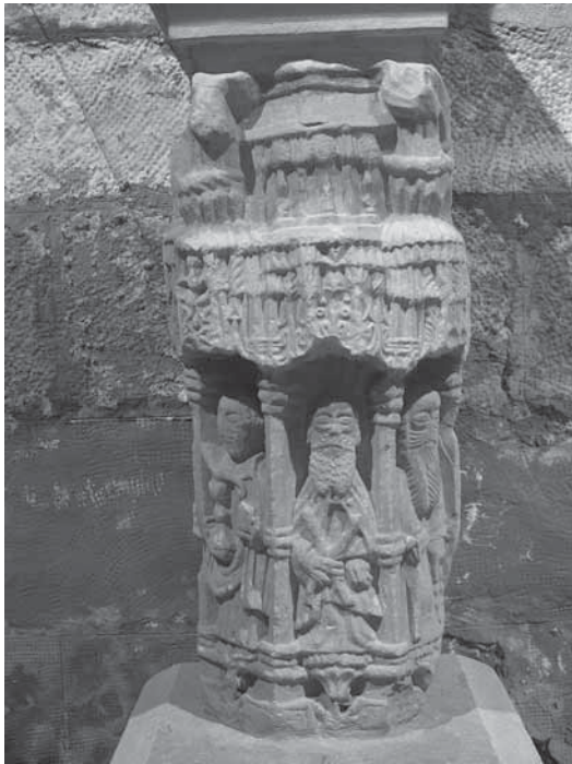
• Fig. 3.- Mestre de Linyola, creu de Linyola, entre 1530-1540.