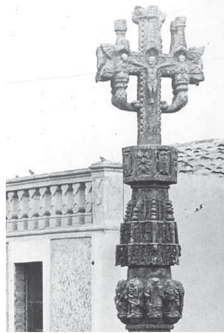
• Fig. 12.- Anònim, creu de Miralcamp, entre 1525-1540.