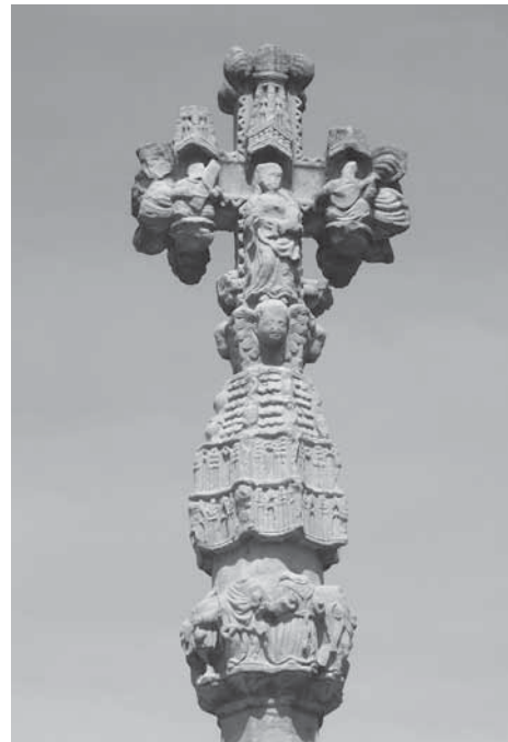
• Fig. 13.- Anònim, creu d'Albesa, entre 1545-1560.