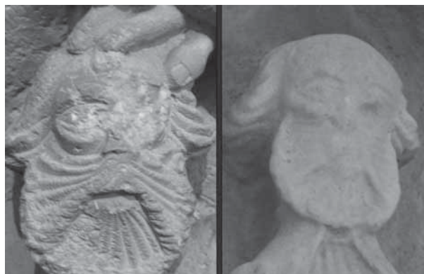
• Fig. 7.- Mestre de Linyola, detalls del retaule de Penelles i de la creu de Castellserà.

A escassos dos quilòmetres de Penelles hi ha la població Castellserà (l'Urgell). Aquí tenim una altra creu de terme del mateix autor ubicada en un extrem de la plaça del Sitjar, a l'extrem del carrer santa Maria, tocant a l'edifici de la Panera (fig. 5 i 7). Aquesta creu fou restaurada i col·locada aquí l'any 1949 ja que fins al 1936 es trobava a l'actual avinguda Catalunya (fragment de carretera LV-3027 que travessa la població), just davant del portal de sortida del poble, on s'inicia el carrer del