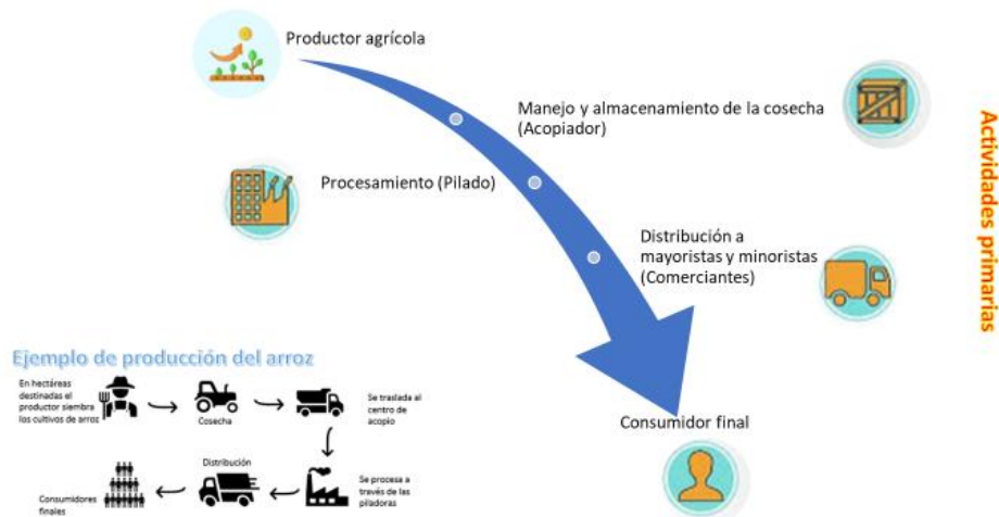
Figura N° 2: Esquema de los involucrados de la cadena de valor del arroz