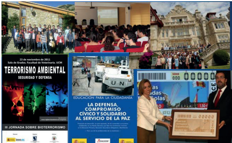
Figura 5. Actividades realizadas por el IEEE para el fomento de la cultura de defensa.

El IEEE también establece convenios con distintos sectores de la sociedad —como la Fundación ONCE y el CERMI— y con otras administraciones públicas, como comunidades autónomas, con el propósito de llegar al mayor número de colectivos posibles, diseñando herramientas ad hoc para cada uno de ellos.