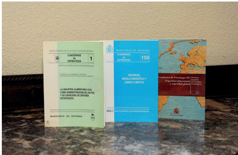
Figura 3. Serie Cuadernos de Estrategia .