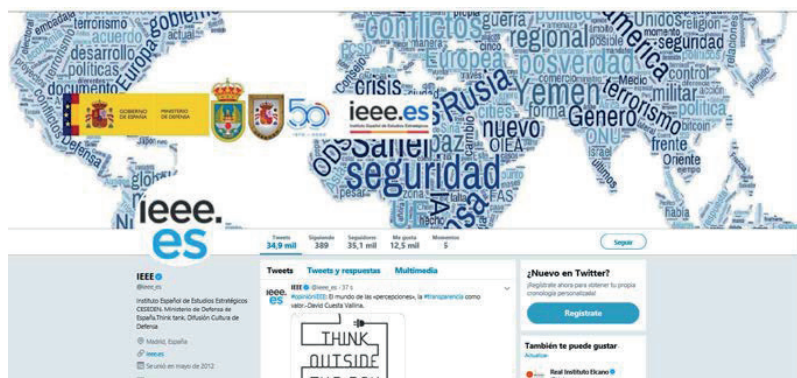
Figura 9. Twitter IEEE.

Además de la web, el IEEE también tiene presencia en las redes sociales, en concreto en Twitter desde 2012 y en Facebook desde 2015.