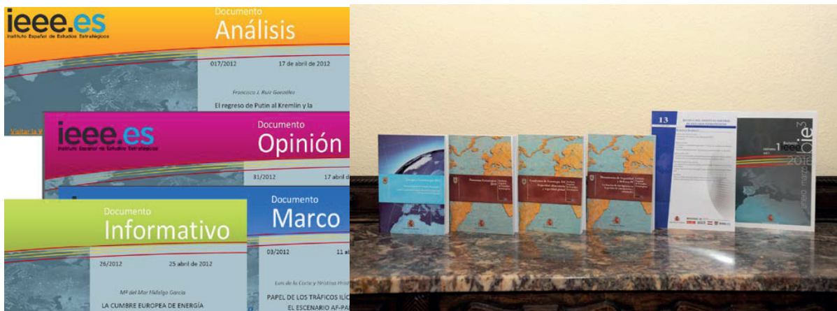
Figura 8. Publicaciones del IEEE.

En esta etapa se produce el auge de los documentos de los analistas del IEEE y de colaboradores externos, disponibles en una web renovada y que se difunden a través del boletín semanal que cuenta con más de 30.000 suscriptores. Además, desde 2016 se crea la publicación bie 3 con el objetivo de recopilar todos estos documentos publicados diariamente en la página web del IEEE y ofrecerlos en una publicación de carácter trimestral, dentro del programa editorial del MINISDEF con su correspondiente ISSN.