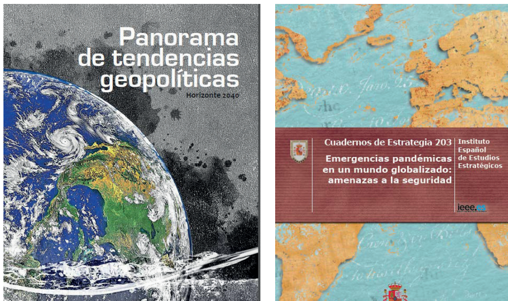
Figura 12. Ejemplos de publicaciones recientes del IEEE.

Hemos visto que, en los 50 años de vida del IEEE, el mundo y la sociedad han cambiado mucho. El IEEE ha ido recogiendo todos esos cambios en sus actividades y publicaciones, en un proceso de adaptación continua, porque si algo caracteriza al Instituto, y que ha quedado patente durante todos estos años, es que es una institución dinámica. Pero, ante todo, el IEEE es un medio que ofrece a los ciudadanos la oportunidad de agregar a su cultura cívica la dimensión de la seguridad y la defensa. El IEEE es una organización abierta a la participación de la sociedad a la que sirve. Todos juntos, analistas y colaboradores externos, seguiremos realizando estudios estratégicos, intentando vislumbrar el camino al que se dirige un mundo cada vez más complejo, observando cómo cambia el panorama geopolítico y analizando las consecuencias de los hechos que se sucedan.