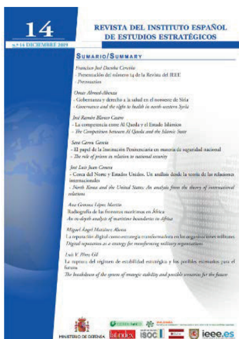
Figura 10. Revista del IEEE.

Este enfoque en la investigación del IEEE conduce a la creación, en 2012, de la Revista del Instituto Español de Estudios Estratégicos ( http://revista.ieeee.es ) de carácter científico e indexada, con objeto de dar respuesta a la creciente demanda de los colaboradores del IEEE de presentar sus trabajos en publicaciones de carácter científico reconocido.