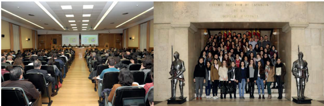
Figura 11. Asistentes a un acto organizado por el IEEE (izda.) y visita de alumnos de la AUM.

También continuamos estableciendo relaciones con las universidades para la realización de jornadas, publicaciones, cursos de verano y prácticas curriculares. Se fomentan asimismo las colaboraciones con centros de investigación nacionales e internacionales dedicados a temas de paz, seguridad y defensa, por su valor como multiplicador del pensamiento estratégico y como foros especializados en cultura de defensa.