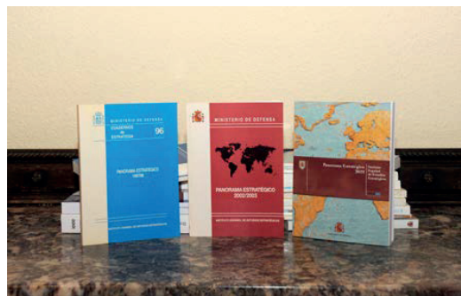
Figura 6- Colección Panorama Estratégico .

Además de esta intensa acción en la difusión de la cultura de defensa en los diversos colectivos de la sociedad española, el IEEE también va consolidando una buena posición en el mundo académico y entre los expertos de seguridad y defensa, con la continuación de trabajos de investigación y análisis dedicados a la conformación de un pensamiento estratégico español. En este sentido, cabe destacar la colaboración con otros centros de pensamiento, tanto en la organización de seminarios como en la elaboración de publicaciones conjuntas. También se amplía la línea editorial con el comienzo de nuevas colecciones de publicaciones como el Panorama Estratégico en 1997 y el Panorama Geopolítico de los conflictos en 2011.