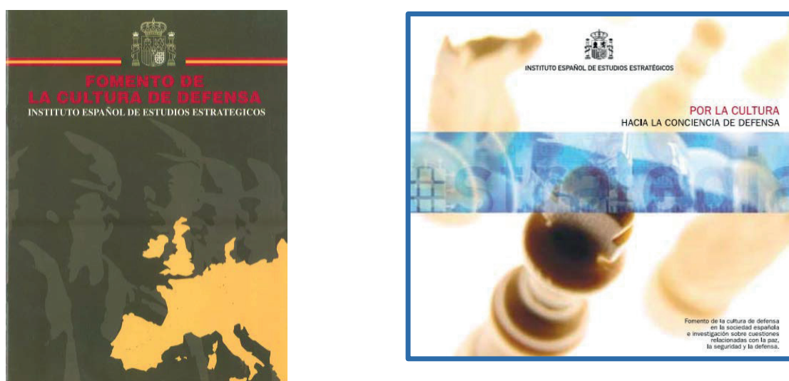
Figura 4. Material promocional del IEEE de 1997 (izda.) y 2004 (dcha.).

Durante esta etapa, la actividad del IEEE está enfocada, principalmente, a emprender acciones que contribuyan al fomento de la cultura de defensa. Para ello cuenta con un equipo multidisciplinar, integrado por personal civil y militar, hombres y mujeres. Es una etapa caracterizada por la apertura a la sociedad a todos los niveles, con la realización de múltiples y variadas acciones contempladas en todos los ámbitos del único Plan de Cultura de Defensa que ha existido en el Ministerio de Defensa y que se aprobó en —un lejano ya— 2003.