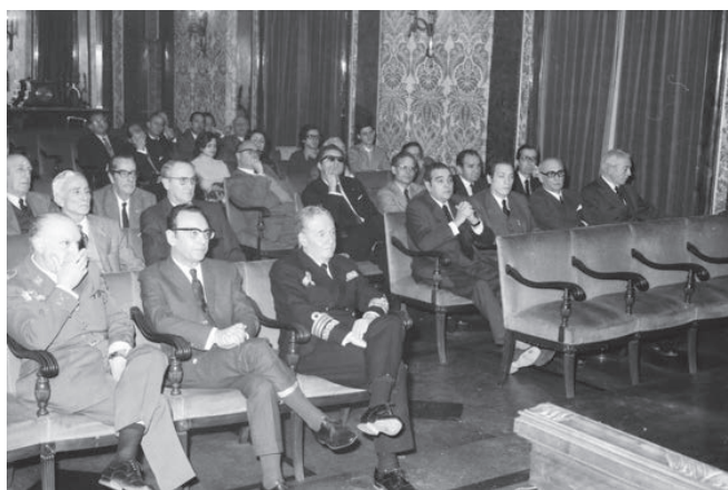
Figura 2. Seminario organizado en el CESEDEN.

En sus primeros años, la actividad del IEEE se basa en la realización de conferencias y la publicación de actas de jornadas en colaboración con distintas universidades españolas. También se realizan estudios y publicaciones de carácter estratégico de uso interno. Poco a poco, el Instituto va ampliando sus funciones encargándose de la redacción del balance anual de situación en el Mediterráneo, la organización de seminarios, la edición de publicaciones relacionadas con la defensa nacional, así como la redacción de diccionarios de términos militares.