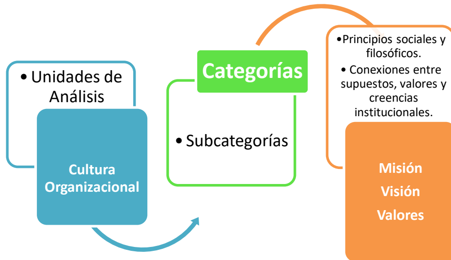
Figura N° 02. Unidades de Análisis, Categoría y Subcategorías

Fuente: textos: Textos: Creating Corporate Cultures. From Discord to Harmony de Herkovichs (1948/2010), Organizational Culture de Schein (1990), Comportamiento Organizacional de Robbins (2004). Elaboración: Propia, 2019.