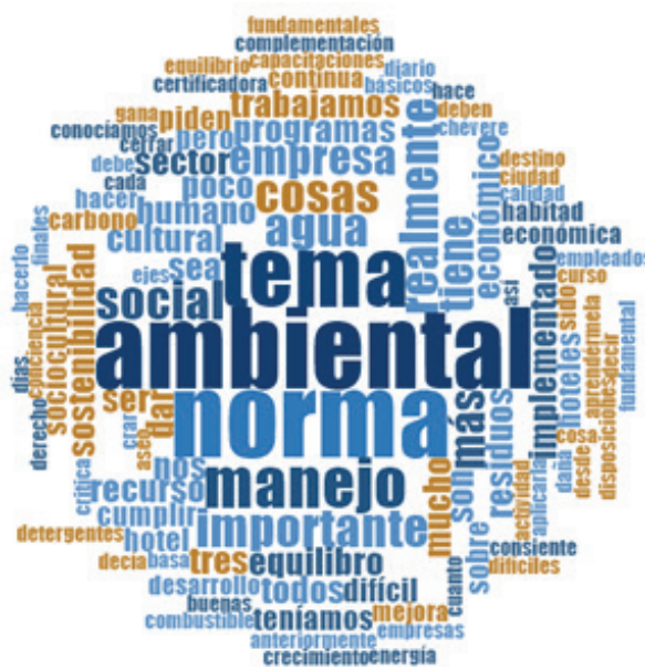
Figura 3. Nube de conocimiento de la NTS-TS 002 de Icontec por empresarios del sector alojamiento de Sugamuxi-Boyacá, Colombia.