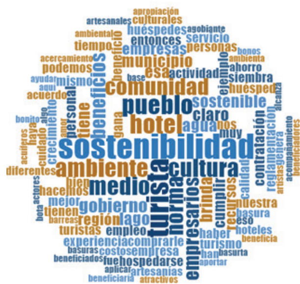
Figura 4. Nube sobre el beneficio de la NTS-TS 002 de Icontec por empresarios del sector alojamiento de Sugamuxi-Boyacá, Colombia.

organizaciones y, además, tiene exigencias específicamente en lo ambiental y social.