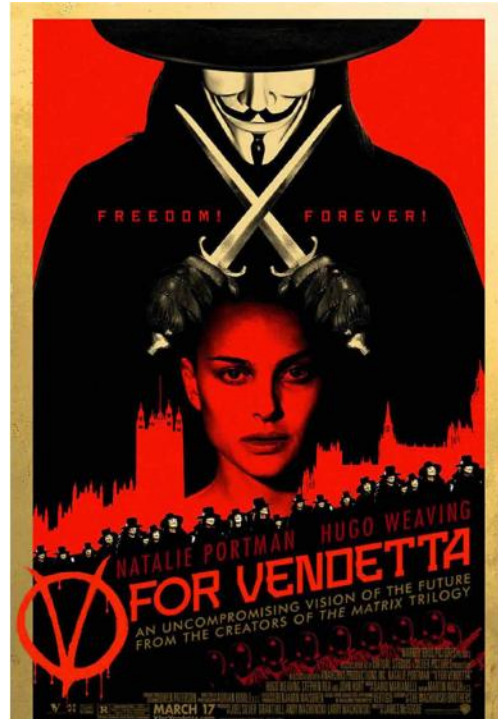
Poster publicitario de la película V for Vendetta (2005)

Ni siquiera su lema más importante: “Somos legión. No olvidamos. No perdonamos. Esperanos” permitía intuir algo diferente a que eran muchos los que tenían ganas de venganza, pero ni una palabra sobre la razón de esa ira. No existía una estrategia elaborada sobre cual eran las prioridades, o cómo sus acciones contribuirían al logro de sus fines. Esta confusión les llevó a dirigir sus ataques de contra objetivos tan heterogéneos e inconexos como el grupo mexicano de narcos “Los Zetas” 16 , los pedófilos de Internet 17 , las asociaciones de gestión de derechos de autor 18 , o el gobierno de Israel 19 .