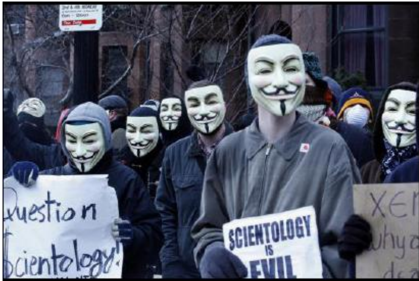
Miembros de Anonymous protestando en frente de las dependencias de la Iglesia de la Cienciología

Los “anons” partidarios de conjugar la diversión y cierta conciencia política se organizaron fuera del foro y dirigieron su primera gran ofensiva coordinada (“Project Chanology”) contra la Iglesia de la Cienciología, a la cual consideraban una peligrosa secta dedicada al lavado de cerebro de sus miembros 4 . Además de sabotear algunas de sus web oficiales, alentaron un boicot global que se trasladó al ámbito físico. Algunos miembros empezaron a protestar en frente de las dependencias de esta iglesia, pero al hacerlo decidieron ocultar sus rostros para no ser identificados y demandados por los cienciólogos 5 . Acordaron utilizar la máscara de Guy Fawkes, un conspirador inglés del siglo XVI, el cual sirvió de inspiración para un comic y una película con un claro mensaje antisistema llamada V de Vendetta . De ese modo nació una estética que se convertiría en el núcleo central de la identidad de Anonymous por encima de cualquier elemento ideológico u objetivo común.