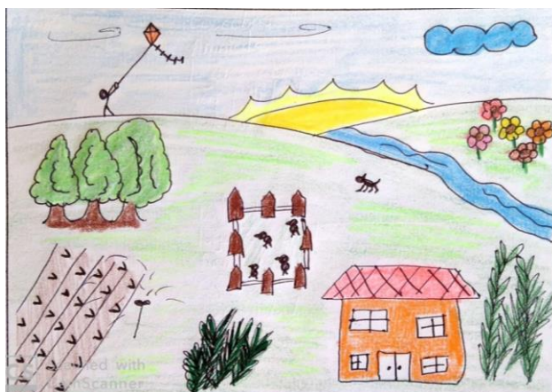
Figura 3.-Representación del paisaje rural con complementos agrarios o agropecuarios

La mayoría de estas representaciones pictóricas guarda una estrecha equivalencia con la categoría de paisaje rural de otros estudios 54 , puesto que, aunque no son frecuentes las personas que cultivan y construyen esos paisajes, se intuye la presencia humana en el desarrollo de la actividad económica. La diferencia estriba en el carácter más agrario o agropecuario que rural de esas representaciones, en las que no se ha registrado la actividad industrial o turística, propia de los territorios rurales en cualquiera de los tres países donde hemos seleccionado la muestra de estudiantes (Figura 3). En este caso concreto, la alumna ha expresado que su dibujo representa “una casa de hacienda, con un lugar para los animales, una plantación y un granjero”.