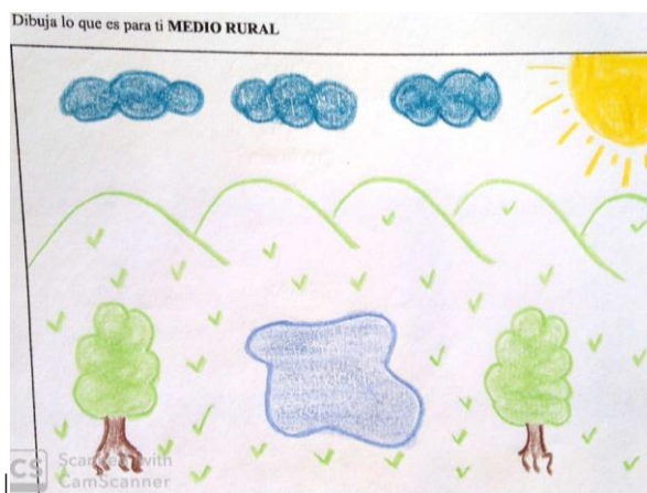
Figura 1.-Representación escolar del espacio rural como paisaje natural

caballos...); las montañas suelen cerrar el dibujo por la parte superior, y los árboles se representan en varias partes de los esquemas mentales. La simbología utilizada es propia de dibujos infantiles, lo que nos indica la correspondencia entre ese grado primario de elementos simbólicos (árboles, ríos, lagos, nubes...) y la idealización del paisaje rural, tal y como se aprecia en el siguiente Figura 1: