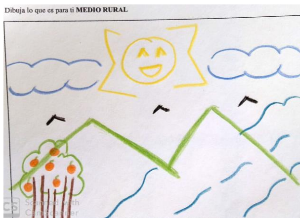
Figura 2.-Representación de lo rural por elementos naturales convencionales

procedentes de la literatura y el arte 53 . La mayoría de estos esquemas mentales no se corresponden con lugares reales que hayan sido visitados por el alumnado, lo que puede explicar que por influencia de una representación idealizada de estos paisajes se haya otorgado más importancia a lo estético que al contenido. Eso ha quedado patente en el grafismo convencional que ha plasmado el alumnado: el Sol ha sido representado como una o media esfera, el cielo abierto y ausente de contaminación en la parte superior del dibujo, la forma de uve para representar los pájaros y la nula representación del medio terrestre subaéreo (Figura 2). Estos ejemplos de elementos convencionales en el grafismo son recurrentes a los otros dos modelos de representaciones pictóricas, como se comprobará en los siguientes subapartados.