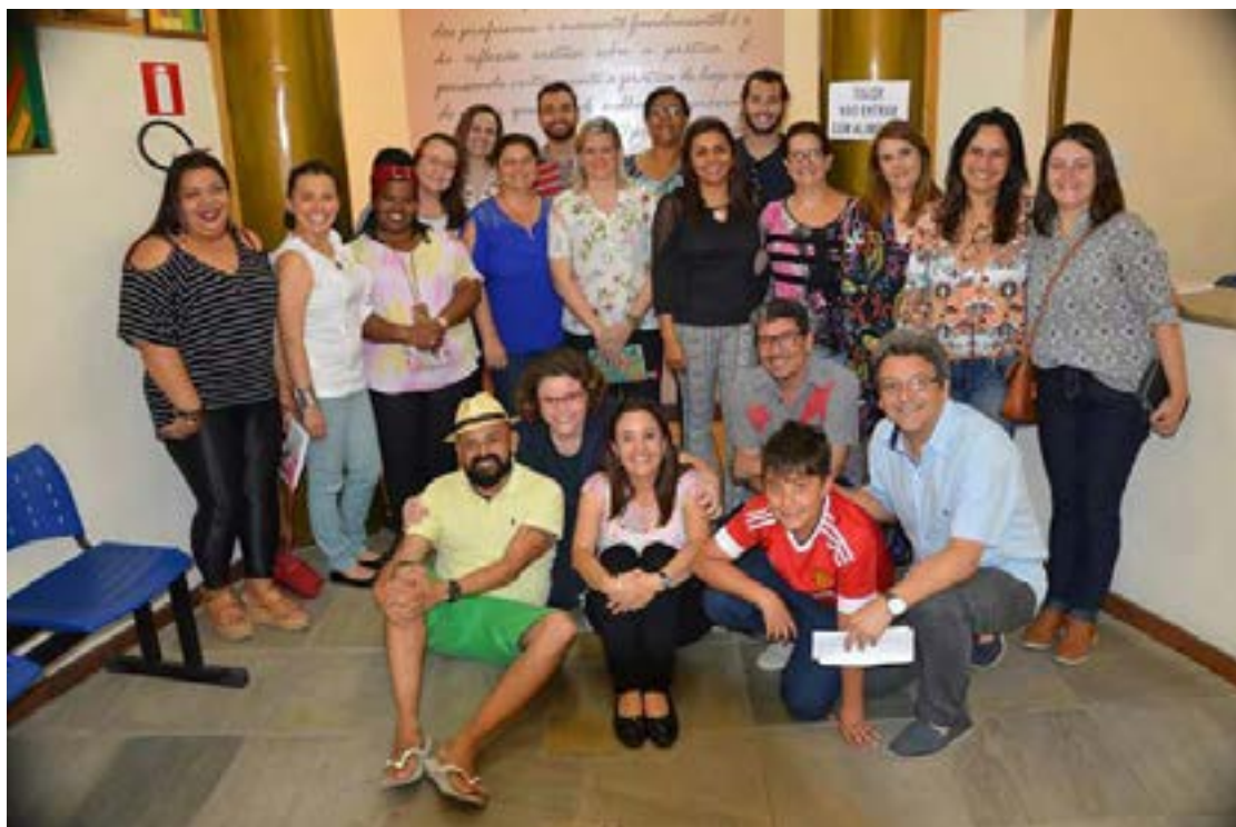
Figura 4. Misión Académica Internacional de Investigación y Educación Colombia- Brasil. Participantes en Encuentro con el equipo de educación infantil del municipio de Juiz de Fora, Brasil. Octubre 26 de 2017.

visitas a Creches, Escolas y Colegios; visitas a Centros de apoyo de la Prefectura de Juiz de Fora; participación en eventos de extensión con docentes del municipio; encuentros con la secretaria de educación y miembros de la prefectura de Juiz de Fora; así como la visita al Centro de Ciencias de la Universidad Federal de Juiz de Fora.