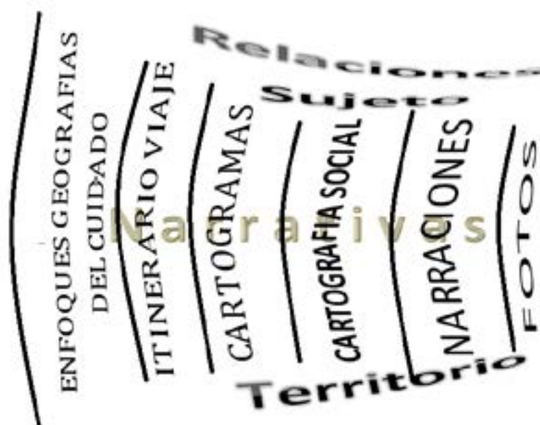
Figura 3. Mapa metodológico y técnicas usadas en el desarrollo del Proyecto de Geografías del cuidado y la crianza.

Sin embargo, el ejercicio investigativo no se ha quedado solo en las técnicas, en la construcción teórica de las categorías, en el trabajo de campo que cada grupo de investigadores hace en Colombia o Brasil con las comunidades originarias Embera Katío y Quilombola Colônia do Paiol , respectivamente; tampoco se ha limitado a las reflexiones de los investigadores vinculados a este proyecto que se reúnen frecuentemente, sino que ha trascendido las fronteras geográficas y lingüísticas para propiciar encuentros presenciales que nutran esta experiencia, en el marco de la internacionalización de Educación Superior, entendida como: