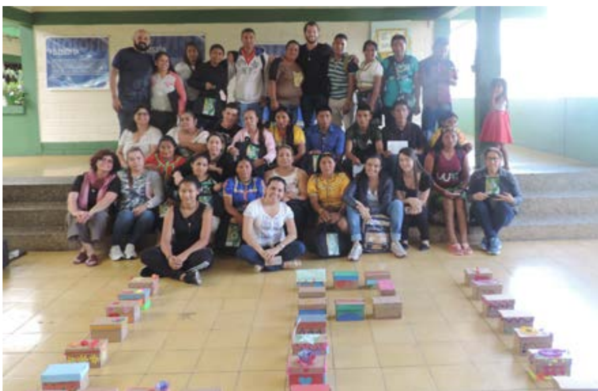
Figura 5. Misión Académica Internacional de Investigación y Educación Colombia-Brasil. Taller de cartografías y mapas vivenciales. Frontino, Antioquia. Octubre 20 de 2019.

Área Andina; visitas a Instituciones Educativas Distritales: actividades culturales y una salida de campo al municipio de Frontino, Antioquia para el encuentro con los estudiantes Embera Katío y libres ; un viaje de dos días que permitió el intercambio de experiencias culturales, profesionales y personales, a través de talleres, mapas vivenciales, y un diálogo intercultural genuino que impactó tanto a los estudiantes como a los investigadores brasileños y colombianos.