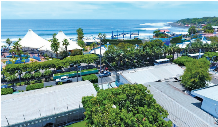
Figura 1. Vista de la ciudad de La Libertad.

La ciudad de La Libertad es la cabecera del municipio del mismo nombre (figura 1). Sus principales actividades se concentran en el turismo y el comercio. La Libertad es la ciudad costera más importante de El Salvador por sus playas, belleza escénica, gastronomía y su cercanía a la ciudad capital, San Salvador (30,4 km). Tiene una extensión de 8 km 2 y el municipio al cual pertenece, de 162 km 2 [2] [3].