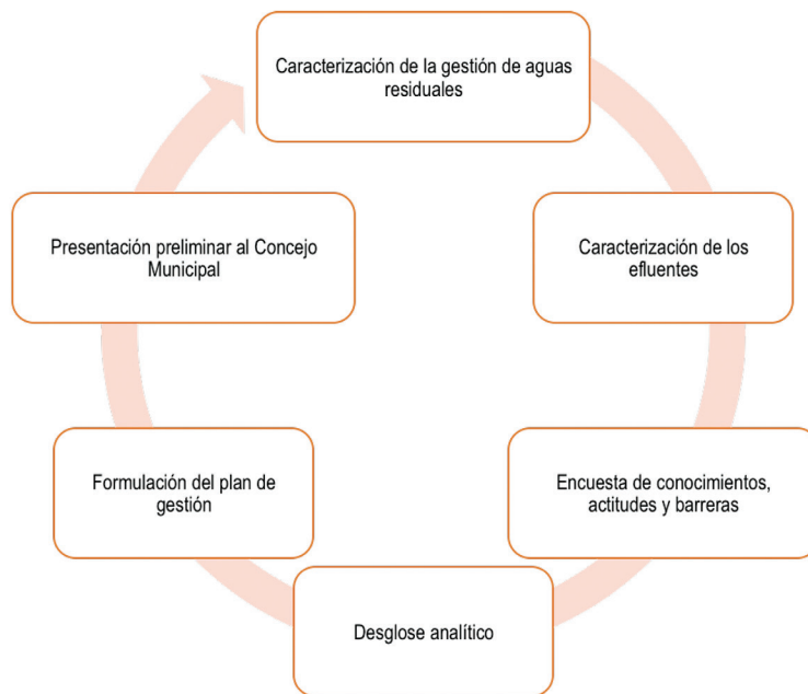
Figura 2. Metodología de planificación