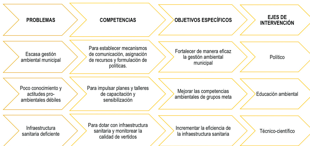
Figura 5. Relación entre problemas, objetivos, competencias y ejes de intervención.

Estos objetivos específicos y competencias por desarrollar se concretan en tres ejes estratégicos de intervención: político, educación ambiental y técnico-científico (Figura 5).