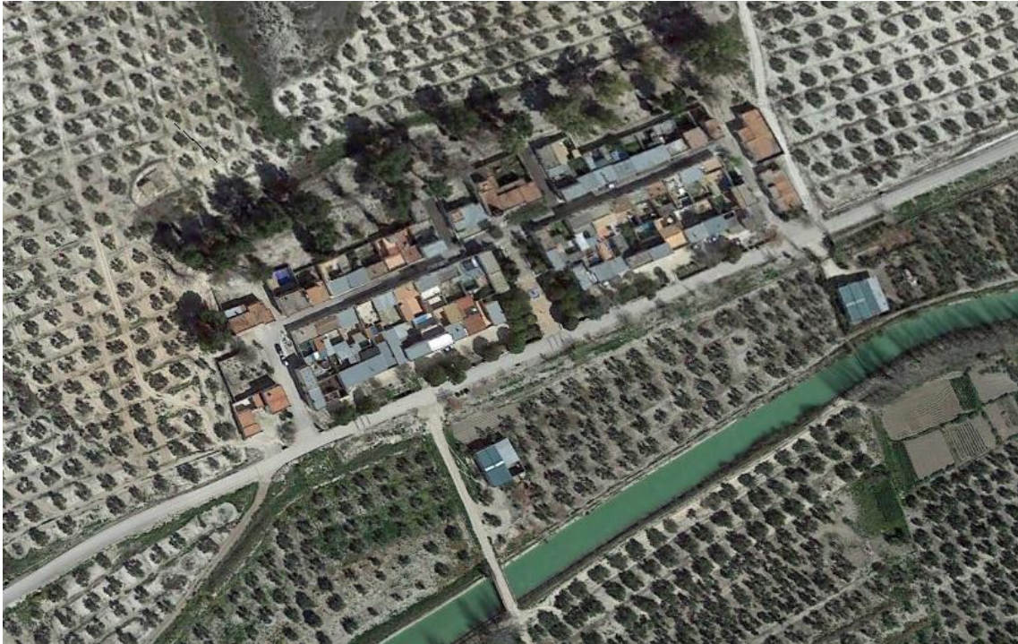
Poblado de San Miguel (Úbeda), junto a la carretera de Ahorcacopos al Puente de la Cerrada.