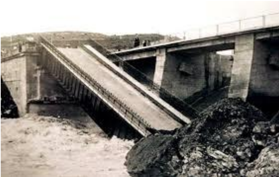
Derrumbe del Puente de la Cerrada tras los temporales de 1963

El puente de hierro se derrumbó por los fuertes temporales de 1963, cuando aún estaba en construcción el embalse, por lo cual tuvo que abrirse al tráfico el nuevo puente de la presa, que formaba parte de ésta.