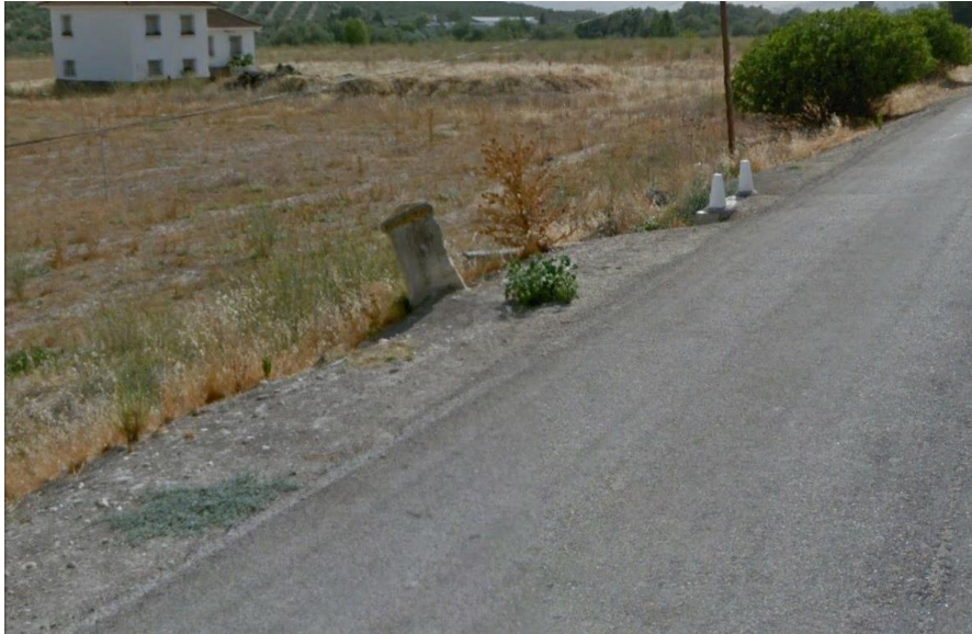
Ubicación del hito de Arhorcacopos al Puente de la Cerrada antes de su depósito en el Centro de Interpretación de la Caminería de la Cerradura.