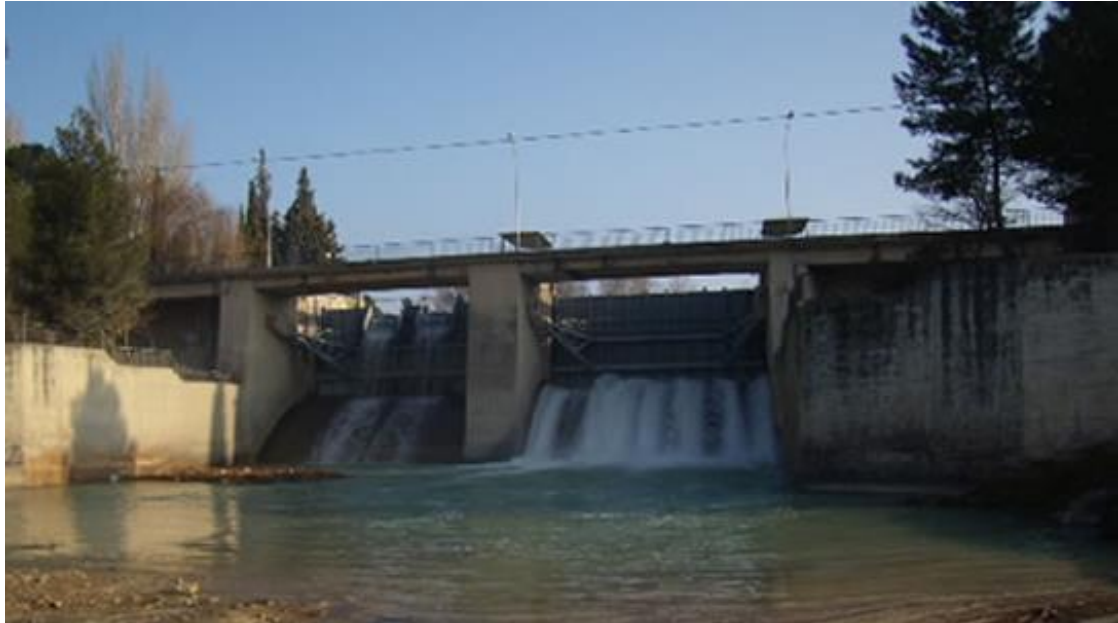
Actual Puente de la Cerrada y presa del embalse.